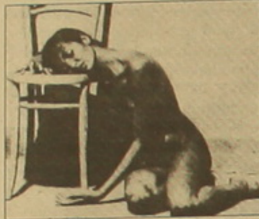
Պաոլո Պազուլինի «Սալո կամ Սոդոմի 120 օր» ֆիլմից:

Իտալացի ռեժիսոր, գրող, կինոսեսարան, փիլիսոփա, լեզվաբան, Եվրոպական Պիեռ Պաոլո Պազուլինի (1922-1975) օտարերկրյան դարաշրջանի հսկայական արվեստագետը, որ հիշվում էր Վերածնունդի դարաշրջանի հսկայական արվեստագետներից: Նրա ստեղծագործական ժառանգության հետաքրքիր էջերից մեկն է 1967-ին հրատարակված «Շեքսպիրական էմպիրիան» Էստե Է. Որո հասկանալի մեթոդները ներկայացվում է ստեղծել: