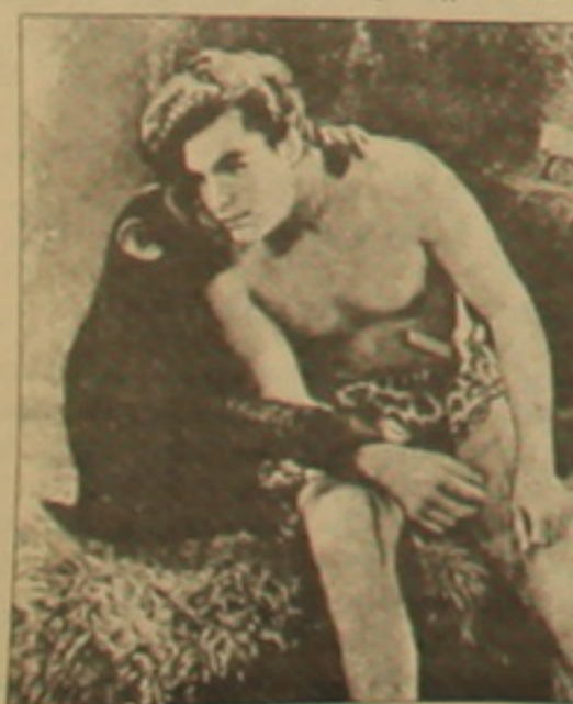
Իր Բրաքին: Այս գեղեցկադեմ լողորդի մականունը Բասթեր էր, ասել է

30-ականներին, երբ իսկական մրցություն ծավալվեց լավագույն Տարգանի կոչման համար, «Փրինսիփլ» կինոսուդիան աստիճանը հանեց իր բեկնածու օլիմպիական չեմպիոն Լարի (Բասթեր) Բրաքին: