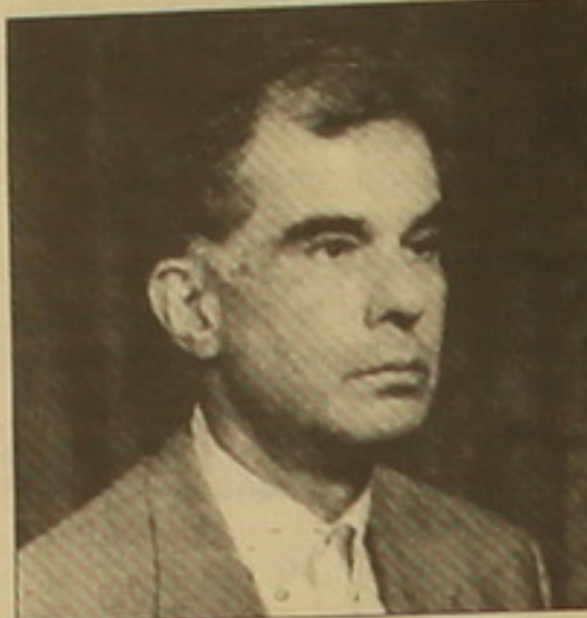
Գեորգ Զ Զորեկյանը: Անցյալի Երանակալ եւ հոգեւոր սեր ժողովրդի ծայրագույն վարդապետ Թաճեյանին իր խորհուրդների համար:

Հայաստանում բխսոնեությունը դեռական կրոն հոյակապ 1700-ամյակի Երանակներում բազմաթիվ միջոցառումներ են անցկացվում, որոնց մի մասը, անկեղծ ասած, կամ արվում է Երանում, կամ կապ չունի այս հոբելյանի հետ: Այս իմաստով հիշատակության է արժանի փարիզաբանական նախկին երեսնամյա երաժիշտ Կոմիտաս Գեորգյանի նախածննդյունը, որը հրատարակել է մեր եկեղեցու հայրապետներից Գեորգ Զ Զորեկյան կաթողիկոսի հեղինակած, մշակած եւ դաճեցված «Պատարագը» մինչ այսօր չհրատարակված ձեռագիրը: