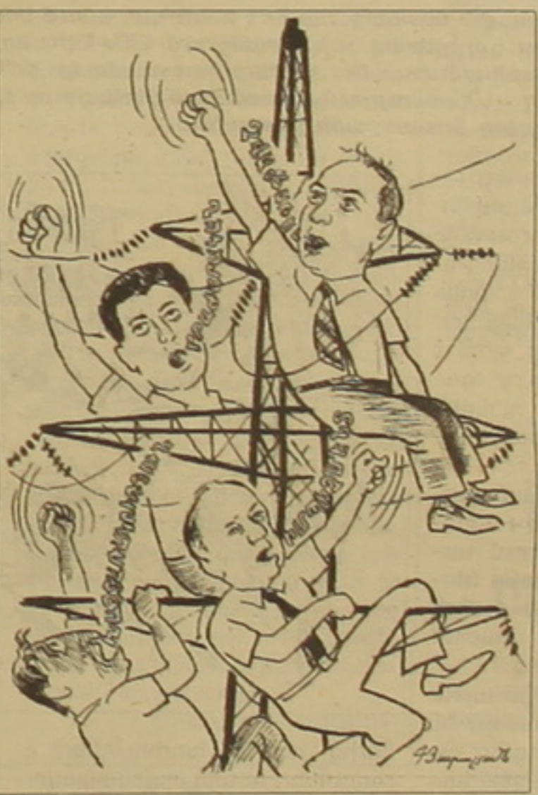
Sbu # էջ 3

Ազգային ժողովրդավարական դաշինքի ղեկավար Արա Կարապետյանը, ելնելով կարեւորագույն խնդիրներում Եւրոպայի քաղաքացիական իրավունքների հետ համագործակցելու սկզբունքներից, ԳԱԱ-ում կլոր սեղան էր կազմակերպել: Կաղված ԲԷՅ-երի սեփականաշնորհման մասին օրենքի ԱԺ «խայտառակ» վերաբերյալ, օրենքի գործունեությունը, ինչպես նաև Արմենստեյլի կողմից ռոտեյվոնի կիրառումը կասեցնելու, կառույցի համակարգից մեքանիզմներ ընդհանրապես վերացնելու հարցերի հետ: Հետաքրքրականը, սակայն, ոչ այնքան նախաձեռնությունն էր, որքան կլոր սեղանին մասնակցող բաղադրական ուժերի քաղաքական, որը, բացառությամբ երկուսի, ծայրահեղ ընդդիմադիր էր. ՀԺԿ, «Հանրապետություն» կուսակցությունը, Ազգային միաբանությունը, Ազգային առաջադիմությունը, Դեմոկրատական հայրենիք, ինչպես նաև ԱԺԿ, «Օրինաց երկիր», «Կայունություն» կուսակցության երեսուցյակն էր: