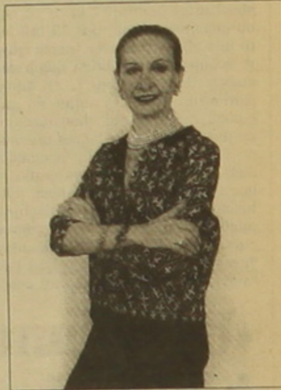
Եւ այնտեղ էի, ուղիղ 4-5 օր ուսումնասիրելով Ղարաբաղը նրա մարդկանց եւ բնությունը, հասկացա: Մի վայրը բացառիկ է, եւ գոյություն ունեն բոլոր ռեալ, թեեւ ոչ դյուրին, միջոցները Ղարաբաղը տուրքովի հրաշքայի գոտի դարձնելու համար: Նախագահի հետ զրուցելով եւ նրա վանությունը ստանալով, մեկուկես տարի մանրամասն ուսումնասիրելուց հետո, գրվեց ծրագիր, որի շուրջն էլ ստեղծվեց բազմաթիվ չիտադրող կազմակերպություն: Ծրագիրը հավանության արժանացավ ԱՄՆ-ում բան հեղինակավոր «Նյու Յորկ արվեստների հասարակություն» կողմից, որը դարձավ մեր գաղափարական հովանավորը: Մեր ողջ գործունեությունն իրականացնում է սեղանի համադասարան դաստիարակների եւ Արցախի մեկուկույթի նախարարության հովանավորության ներքո: Ծրագրի իրականացման օժանդակում է Արցախի վարչապետը, ում հոգածությամբ արդեն սկսված են Շուրջի մայր տղորդայի վերանորոգումը, ջրագծերի ու էլեկտրագծերի անցկացումը աշխատանքները: Արցախում ունենք 6 հոգուց բաղկացած հանձնախումբ, որն անմիջականորեն զբաղված է այս աշխատանքներով:

- Առաջին եւ գլխավոր նպատակն Արցախի օգնությունը ցույց տալն է, որ ժողովրդի այն զարգանա եւ դառնա մեկուկույթի կարելու կենտրոն: Ղարաբաղը դեռեւս դաստիարակող ճանաչում չի ստացել փառապաշտան աստիարակում, առավել եւս, որ գտնվում է աշխարհին իչ հայսնի սարածաբանում: Բազմաթիվ այլ խնդիրների հետ մեմ գտնում ենք, որ եսկան է Ղարաբաղն աշխարհին հայսնի դարձնել որդես արվեստների եւ երաժշտության ավանդական փառասոցի վայր փամփ որ արվեստը հոգու ճարտարանն է, եւ ստեղծագործական փայլունքացն եւրդես բուժիչ է: Սեղաններին նախաստեղծում ենք Շուրջում կազմակերպել առաջին փառասոցը, որը կկրի սիմվոլիկ բնույթ, կլինի առավել փոքր ծավալի: Այս փառասոցով մեմ նպատակ ունենք ստեղծելու համահայկական 2002 թ., եւ համաշխարհային 2003 թ., այնուհետեւ դարբերաբար կրկնվող փառասոցների մոդելը: