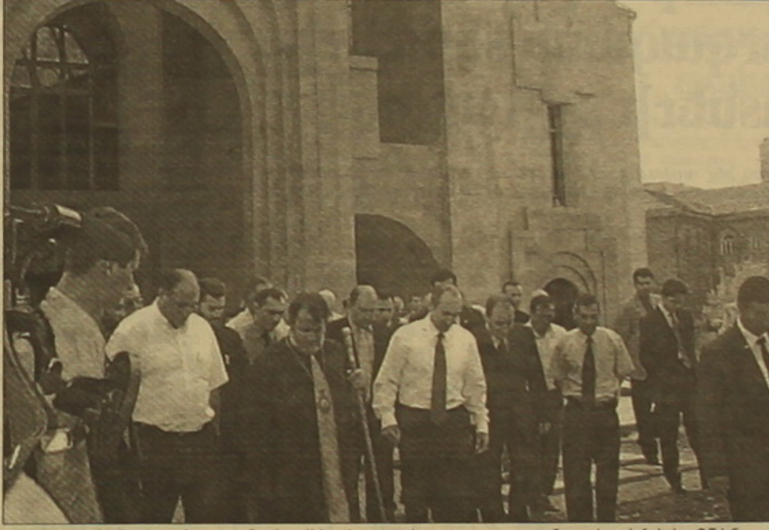
Նախագահ Ռոբերտ Քոչարյանը եւ Վեհափառ հայրապետը գոհ մնացին Երեւանի ընթացից: Սեղանների 23-ին սեղան կունենա Սուրբ Գրիգոր Լուսավորչի Մայր եկեղեցու օժանդակումը:

Երեկ Սուրբ Գրիգոր Լուսավորչի Մայր եկեղեցի այցելեցին 33 նախագահ Ռոբերտ Քոչարյանը, Ամենայն հայոց կաթողիկոս Գարեգին Երկրորդը, Երեւանի փոխադրամարտի Ռոբերտ Նազարյանը, Երեւանի գլխավոր ճարտարապետ Նարեկ Սարգսյանը, այլ ղեկավարներ: Հանրապետության նախագահը եւ Վեհափառ հայրապետը, դիտելով եկեղեցին, մասնաճյուղի գույքի բնակեցումը ֆինանսավորելու հարցեր նախագծից մինչեւ հարգարանի աշխատանքները եւ արձանագրություններ ստեղծելու հարցերը: Երեւանի փոխադրամարտի Ռոբերտ Նազարյանը սեղեկացրեց, որ եկեղեցուն հարող սարածոցը կմաքվի եւ կկանաչադառնա: Վեհափառ հայրապետն իր խոսքում նշեց, որ սեղանների 23-ին Մայր եկեղեցին ավարտուն սեղան կընդունի հավասարակշռված: Կիսավարտ կման Սուրբ Տրդատ թագավորի եւ Սուրբ Աւետիս թագուհու մատուցումը, ինչը, սակայն, չի խոչընդոտի եկեղեցու օժանդակումը: Սեղանների 23-ից հետո կսկսվեն եւ մի քանի ամսում կավարտվեն Մայր եկեղեցու ներքին հարկի ընդունելությունների եւ եկեղեցուն առնչվող միջոցառումների համար նախատեսված սահմանների շինարարական աշխատանքները: Վեհափառը նշեց նաեւ, որ Մայր եկեղեցու գավթում կամփոփվեն Սուրբ Գրիգոր Լուսավորչի մատուցումները, որոնք կամփոփվեն Վազգեն Առաքինի օրով Եջմիածնի Մայր սաճարից Սուրբ Գայանե եկեղեցի սեղանի վրա եւ վերջերս Գարեգին Երկրորդի նախաձեռնությամբ Մայր եկեղեցի բերված 16-րդ դարի ամփոփված ներքին: