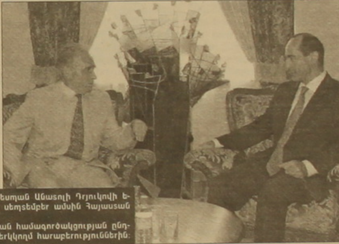
Sbu 1 էջ 2

ստանվելով հայկական կողմի դաշնակցական որոշ մեկնաբանությունների, որոնք, դասելով ՀՀ նախագահի երկվա դաշնակցականներից, չուսացան. Գ. Մ.): Ռ. Քոչարյանը հնարավոր է համարում ՌԴ-ին Հայաստանի մոտ 114 մլն դոլարի դրամի դիմաց հայկական ձեռնարկությունների հիմնի վրա հայտնուական համատեղ ձեռնարկություններ ստեղծելու ու դրանց բաժնեկցությունների մեծ մասը ռուսական կողմին փոխանցելու առաջարկությունը: