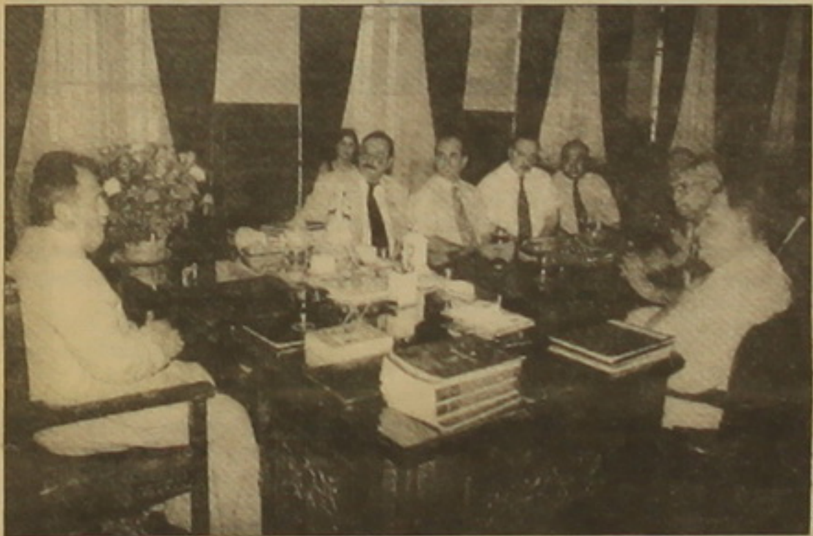
ՄԱՅՐ ԱՅՈՒ ՄԲ.

Հայաստանի բարեկեցիկ, լուսավոր աղաքան կերտելու համար անհրաժեշտ է, որ յուրաքանչյուր հայ ներդրի իր ավանդը: Վերջին տասնամյակը լավ կարելու է եղել մեր դեպքում: