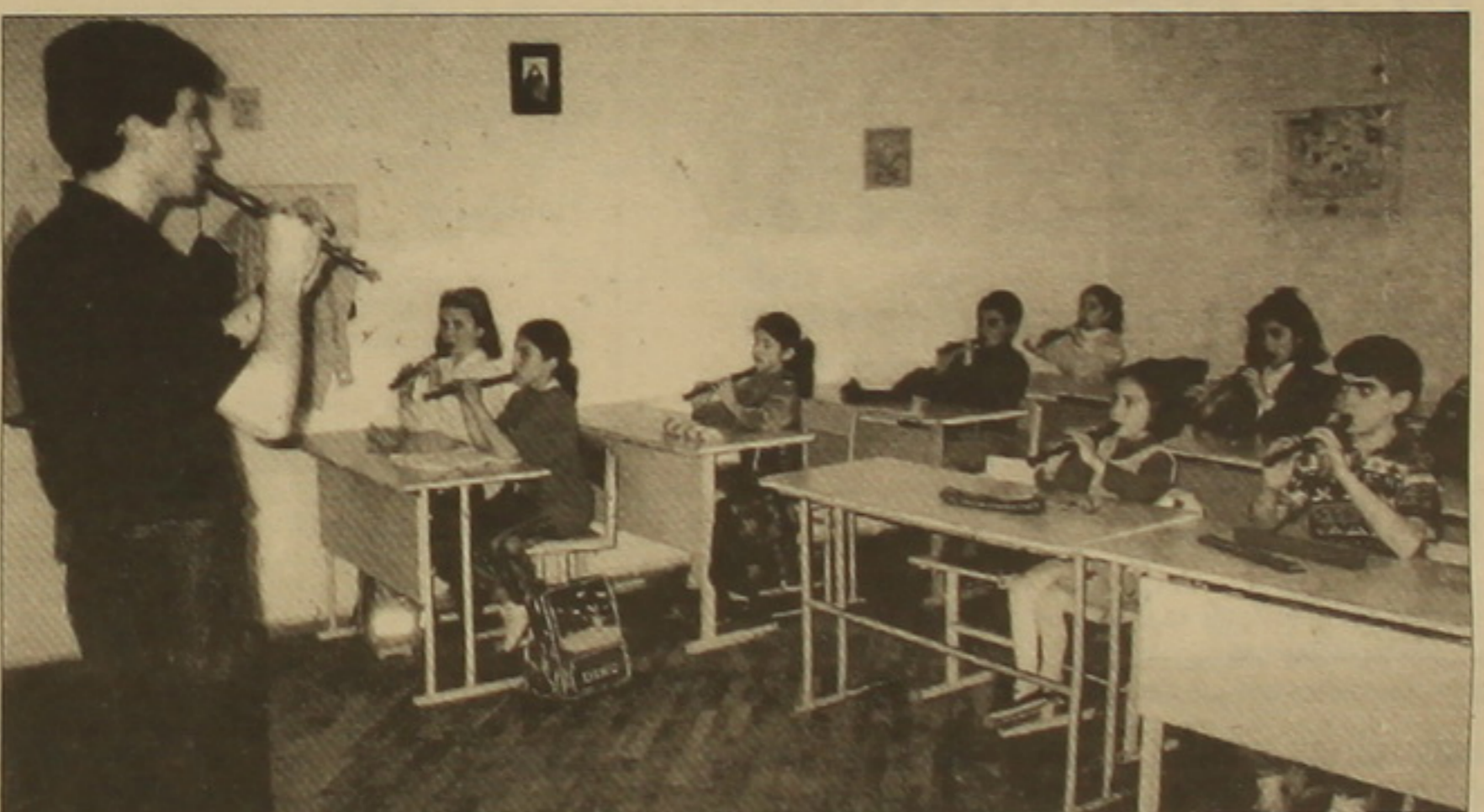
Երեւանի դասարանի թիվ 30 դրոշմերը ուսուցումը վաղորդական մանկավարժության մեթոդով անցկացվող դասարաններից մեկում:

Նրանց մեծ մասն ունի մասնավոր դրոշմի կարգավիճակ, իսկ եվրոպայում այդ դրոշմերը ստանում են ժողովրդական օժանդակություն՝ Գերմանիայում ծախսերի մինչեւ 80 տոկոսը, Նիդեռլանդներում՝ 100, ավարտական վկայականները ծանաչված են ժողովրդական կողմից: