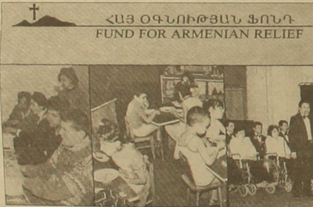
ՀԱՅ ՕԳՆՈՒԹՅԱՆ ՖՈՆԴ FUND FOR ARMENIAN RELIEF

Ամեն տարի մեծական բուհերի 10 առաջին կուրսեցիներ մինչեւ 5-րդ