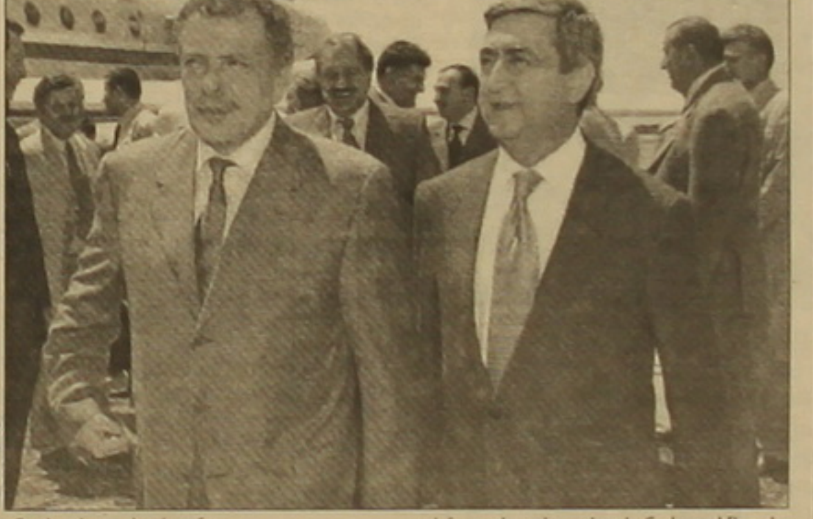
Մակահասվածում: Ինչոպես հույս ունի ՌԳ փոխվարչապետը, սենսաձայն համագործակցության հարցերը կլինեն ՌԳ նախագահ Վլադիմիր Պուտինի սեղաններին Հայաստան կասարելի այցի գլխավոր խնդիրը: Մեր ժամանումն այդ այցի նախադասման ավարտական փուլի սկիզբն է, հայտարարեց փոխվարչապետը: Sbu 1 էջ 8

«Հայաստանի հետ բաղաձայն փոխհարաբերությունները մե՛նք ցնայահասուն են իդեալականին մոտ, մյուս բոլոր հարաբերությունները շատ բարձր մակարդակի վրա են»: Այս հայտարարությունը երեկ արեց Ռուսաստանի փոխվարչապետ Իլյա Կլեբանովը ժամանելով Երևան երկօրյա աշխատանքային այցով: Նա գլխավորում է Հայաստանի հետ սենսաձայն համագործակցության միջկառավարական հանձնաժողովի ռուսաստանյան մասը: Փոխվարչապետի կարծիքով, «ղեֆ է առաջ ֆաշել մեր սենսաձայն կառուցելը»: «Դա մեր այցի գլխավոր մասն է մեր սենսաձայնությունների ինտեգրումը, ռուսաստանյան ներդրումներն ու այն ամենը, ինչ դրա հետևում է», հայտարարեց Իլյա Կլեբանովը: Նա խոստերով «մեր սենսաձայնությունների իրական ինտեգրումն այն գլխավոր խնդիրն է, որ մենք միջի լուծենք մոտակա ժամա»: