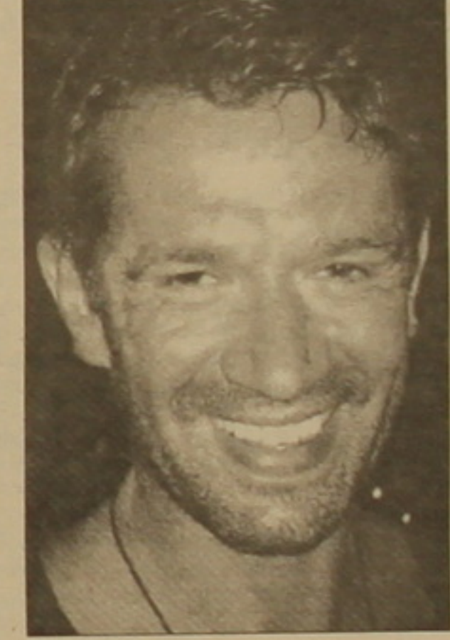
սալիս ծաղկել»: Ինչեւ, «Անգաղիվ մրցությունն» արժանացավ լավագույն ռեժիսորական աբխասանքի համար սահմանված մրցանակին: Սկոլան ինքը ներկա չէր փառատոնին, եւ մրցանակը հանձնվեց ֆիլմի որդյուներին: Առաջին մեծությունը դեմերն ու Շոն Փենի, Վուդի Յարելսոնի նման ասղերը, ինչպես միս, Մուսկովյան փառատոնում այնքան ինչ էին, որ նրանց կարելի էր մի ծեղրի մասերի վրա հաւել: Ամենամեծ սենսացիան Ջեֆ Լիդլսոնի հայտնությունն էր՝ իր երիտասարդ ընկերուհու՝ Լարա Ֆլին Բոյլի ուղեկցությամբ: Լարային հուրախություն իրեն եւ ի հուսախաբություն Շուկեմի այրու՝ Լիդիա Ֆեդոսեա-Շուկեմայի, նրա հյուս վերադու ընծայեցին, որը օրենքորգանք բոլի յուրահասկության համաձայն, անցնում էր մասանու միջով: Իսկ Լիդլսոնին մեծարեցին Ասանիսկովու անվան մրցանակով, որը հոլիվուդյան գերասղը մոտացավ բեմում: Փառատոնի փակվան արարողությանը նրա ընկերուհին լկարողացավ զաղել հորանը: Է՛հ, երկար է, երկար լուսնի ճանադարհը:

նի «Քաղվարդերի տաղավարում» մարմնավորել է Պելինյան օմերայի լեգենդար մեծակատարուհի Գու Յզինցյուին: Թախժալի մեղեդիներով, նրին արդումներով ե ղեկաղեներական գեղեցկությամբ ներծծված այս ֆիլմի ռուս կանացի, զգայական աբխարիում նույնիսկ սերը լեթիալան երանգ ունի: Իսկ ժյուրիի հասուն մրցանակը ընդհանրապես իրանցի կին ռեժիսոր Ռախան Բանի եթեմաղի «Քաղվարդերի տաղավարի» սարաբխարիկ հմային, հարկ համարեց հավաստել, որ նախադասվությունը սալիս է հասարակական հնչեղությունը օժտված կինոյին: Փառատոնի գլխավոր մրցանակակիրը դարձավ ամերիկացի ռեժիսոր Յենի Բինի «Ֆանասիկոսը», որն արդեն նվաճել է անկախ կինոյի Մանդեմի փառատոնի գլխավոր մրցանակը (ժյուրիի անդամների թվում էր