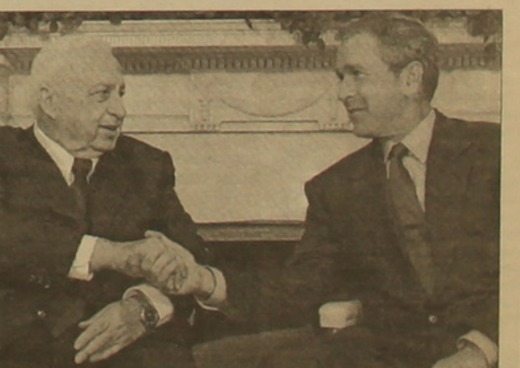
սուլիսում լրագրողներին կոչ է արել չարել ուսադրությունը Իսրայելի եւ ԱՄՆ-ի դիրքորոշումներում եղած հակասությունների վրա: Նրա ասելով, բանակցություններն անցել են դրական մթնոլորտում:

ԹԵՒ ԱՎԻՎ 27 ՅՈՒՆԻՍ, ԱՐՄԵՆԴՐԵՆ: Իսրայելական զանգվածային լրատվամիջոցները մասնավորապես են իսրայելի վարչապետի եւ ԱՄՆ-ի նախագահի միջև եղած լուրջ սարաձայնությունները, որոնք դրսևորվեցին այս գիտեր Վալենտինով ավարտված հանդիպման ընթացքում: Դիտորդներն ընդգծում են, որ Արիել Շարոնը եւ Ջորջ Բուշը միանշանակապես տեսակետներ են արտահայտել իրադարձի հարցի քուրջ: Իսրայելի վարչապետը ղեկավարում է լիովին դադարեցնելու բռնությունը, այնուհետեւ սասնօրյա անդորրի քաղաք եւ 6-8 քաղաքակա փորձաքաղաք սահմանել, մինչդեռ Բուշը ղեկավարում է, որ ակնհայտ առաջընթաց է առկա, ուստի եւ արդեն այժմ ղեկավարելու իսրայել-ղեկավարող երկխոսությունը: Մյուս կողմից Շարոնն ինքը Վալենտինով կայացած մամուլ ա-