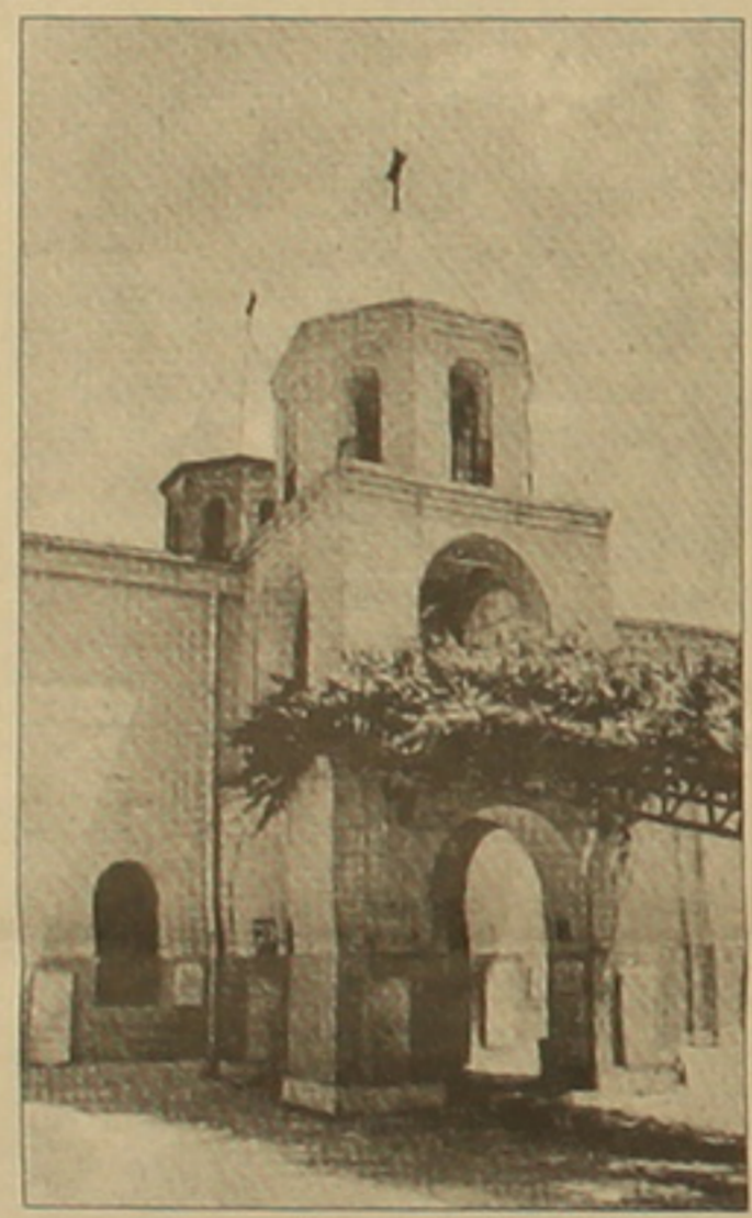
Թեհրանի Ս. Գեւորգ եկեղեցին:

սարկման նկիրական գործին», մեկնեց Սեմոուի եղիսկոտուրը: Արազան, բայց չե՞ք ժամանակն է առաջնորդվելու «Սեկ ազգ, մեկ եկեղեցի, մեկ հայրենիք» կարգախոսով: Չե՞ք Մայր աթոռն է աշխարհով մեկ ցրված, բախտական հայ դասաողների միասնականության խորհրդանիշը: Լավ չե՞ք լիտի, որ լինել մեկ աթոռ՝ Սուրբ Էջմիածինը: «Ես կարծում եմ, որ որդես դասական իրողություն և դասական երկուսը երկու աթոռների գոյությունը ոչ մի ձեւով եկեղեցու ներին կյանքը չի խանգարում: Հայաստանը, կասկած չկա, մեր բոլորի հայրենիքն է, Հայաստանի այսօրվա ազա, անկախ գոյությունը մեր տարիների երազն է: Սղյուտի մեջ ձեւել և այդ տեսիլով են մեծացել: Բայց նաեւ ընդունեմ, որ սակավին Հայաստանի մեջ և Հայաստանի համար, մեր դասական իրավունների ձեռքբերման համար, մեր ճիգի և լիտի մեջ մեմ աս բան ունեն անելու: Երկու կաթողիկոսական աթոռները մեկը Հայաստանում, մյուսը Հայաստանից դուրս, ավելի մեր դասին նդասող ֆաղական իմաստով իրողություն է, ֆան վնասակար: Այս իմաստով, հասկաղես Կիլիկիո կաթողիկոսությունը, որ ասանդական, բախտական է Լիբանանի մեջ, մի ձեւով խորհրդանիշ է մեր ժողովրդի ազատարական լիտի և դասաողական ոգին: Այս լիտի կարունակվի այնքան, ֆանի դեմ մեր ժողովուրդն իր ամբողջական երազը չի իրականացրել», ասաց թեհրանահայոց թեմի առաջնորդը: