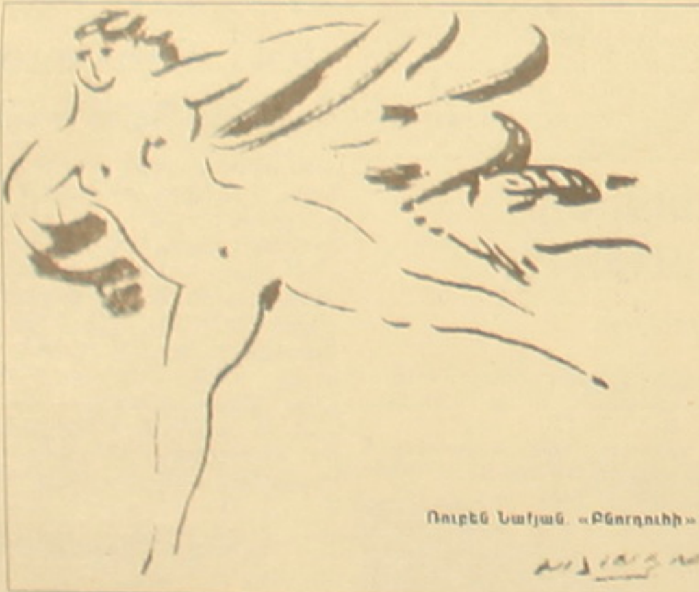
Ռուբեն Նախյան. «Բնորոհի»

րոնց արժեքն անգնահատելի է: Ու այս ամենը նկարչություն է: Ամերիկայում աղաւս եւ իրենց մակաւանցում կնւած Հայկ եւ Ալիս Ասատույանները 1960-70-ական քվականներին իրենց դասեր փոխիկ Սեդրակի հեծ այցելում էին հայրենիք: Բնավորությամբ մեղմ, համես, բարեհամբուր այս անձինք սիրում էին արվեստը եւ սեփական հավաքածու ստեղծում, բեծե իրենց միջոցները այնքան էլ լայն չէին: Սենք խոսում ենք հաճախ սփյուռֆ հայրենիք կապերի մասին եւ միջ փնտրում ենք մեր կանուրներն ավելի ամրագնող կապեր, բայց չգիտես ինչու միջ չեն արդարանում այն ցանկությունները, որոնք այնքան անհրաժեշտ են հենց այդ կանուրների ամրագնան համար: Անուր, զանազան դասուսուցիչներ կան: Եվ այս անգամ, այս ցուցահանդեսի առիթով ղեկ է իսկապես հոգաւորությամբ ու հուզմունքով խոսել: Լախ, որ զգալի թիվ են կազմում նկարչության ցանկում եղած աշխատանքները: Բացի Ազգային դասերաստիումի նկարչական 42 գործից, եւս 55 աշխատանք նկարվել է Մայր աթոռ Ա. Էլմիադինի Գանճասանը: Երկրորդ Հայաստանում այսուհեծ կլինեն նոր արվեստագետների գործեր, որոնց բարուն հասկապես արժանահեծասակ են ամերիկյան ֆանդակագործության եւ նկարչության ոլորտում մեծ հեղինակություն վա