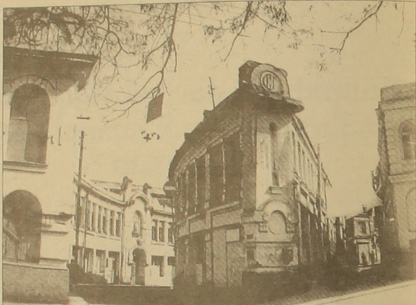
«Մանթաբաչյան անուանակալ շքեր» (այժմ կոչվել ու կազմի գործարան): Վասնի ոչաղ փողոց, Ինժեներ-ճարտարապետ Ղազար Սարգսյան: