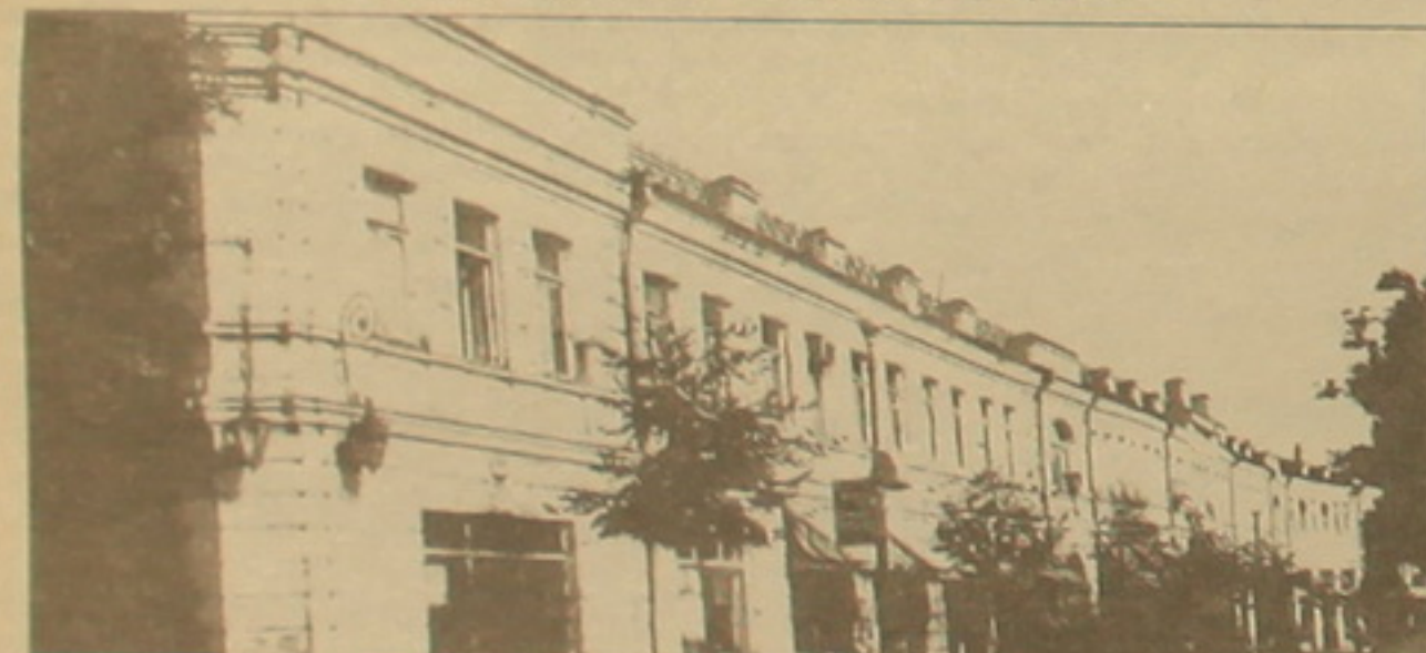
Ալ. Մանթաբաչյանի ֆաբրիկայի շինությունը, ինչպես եւ անուանակալ տունը (այսօր այդտեղ են տեղափոխված Թիֆլիսի Կրեմլի Կրեմլի ժողովրդական դասարանը «Ամիրանի» կարի ֆաբրիկան եւ ոսկերչական գործարանի մի մասը Շինությունը գտնվում է Արմյանսկի բազար (այժմ Լեռնոնոսովկայա) փողոցում, թիվ 22: Կառուցվել է 1881 թ.: 1902 թ. շինվել է նաև կից կառույցները: