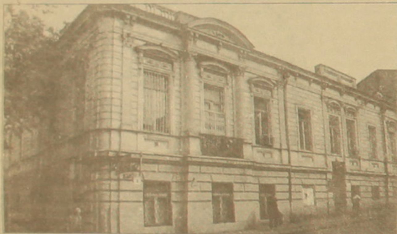
Մանթաբաչյանի ընտանեկան հիմնական կազարանը, որը գտնվում է Լեռնոնոսովկայա եւ Պատկեղի Թիֆլիսի Կրեմլի Կրեմլի փողոցների անկյունում, թիվ 18/8 (ճարտարապետ է Զիլստաֆոր Տեր-Սարգսյանը): 1922 թ. տունն ազգայնագրվեց եւ վերանվեց «Արժեսի տուն»: