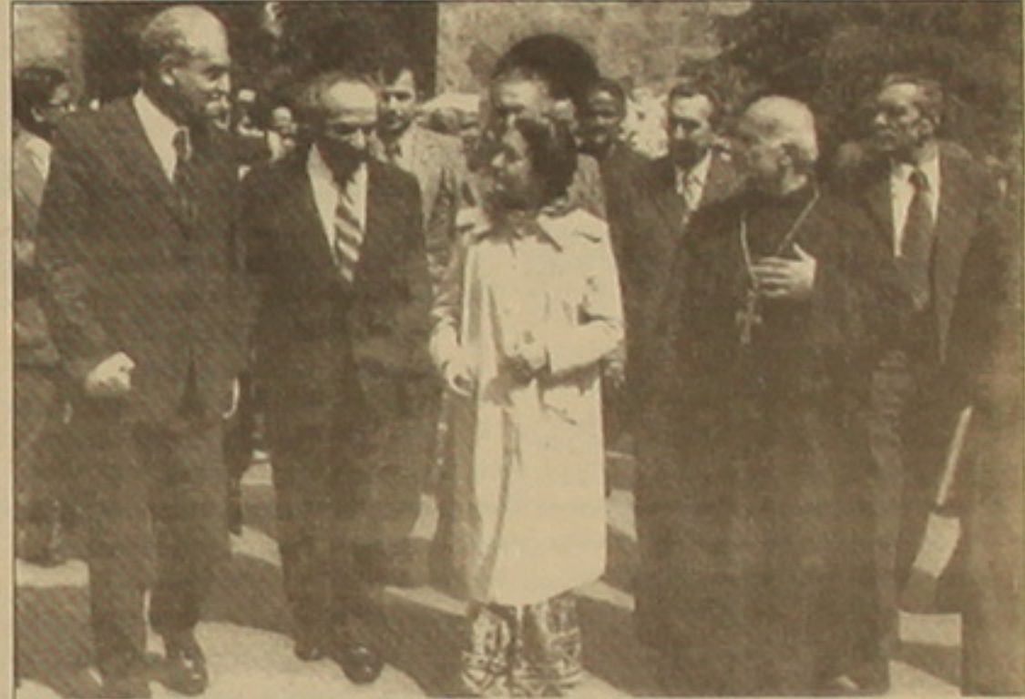
1976 թ. Ինդիա Գանդիի Հայաստանում

584550) արձանագրության համար: Առավոտյան ժամը 9:30-ին սկսվող փոքր ուղեգիր սիրահարների մրցաբարձը նախատեսված է Մոսկվայից ոչ միայն Հայաստանի ամենասիրված մարզաձևերից մեկի վերականգնմանը, այլեւ հայ եւ հնդկ ժողովուրդների դարավոր բարեկամության ամրապնդմանը: Մանավանդ որ Հայաստանն իր մեծ սերն է արտաքին ժողովուրդների հարգմանը արժանացրել է 20-րդ դարի ֆաղափական-ազգա-