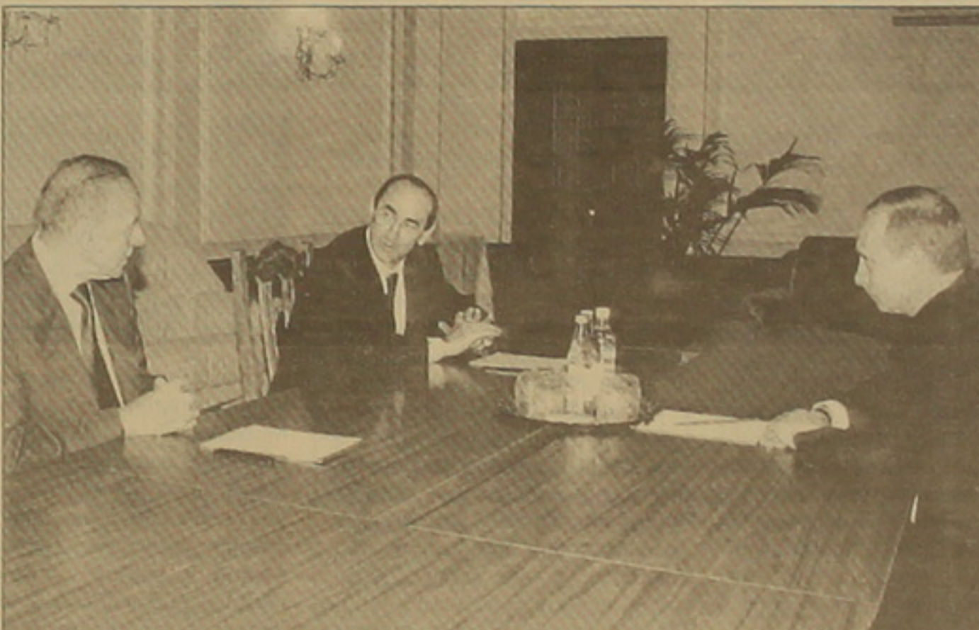
Գ. Ա.) կարծում ենք, որ ժնեյան հանդիպումը դեռուս բավարար նախադրարար ստացված չէ, որոնք սակավարար հաջող ստացվի»: Մենք (մինսկյան համանախագահողները)

Բելառուսի մայրաքաղաք Մինսկում ԱՊՀ անդամ ղեկավարներին եւ կառավարությունների ղեկավարների խորհուրդների միջոց առաջ կայացավ հանդիպում նույն ֆորմատով: Հիշեցնենք, որ հանդիպումը կայանում է լուրջ հարցականի սակ դրված ժնեյան հանդիպումից առաջ եւ հաջող ընթացի դեպքում կարող էր նախադրյալներ ստեղծել ժնեյում նախագահների հանդիպման համար: Ռուսական կողմը, սակայն, ինչպես դարձավ Մինսկում զսնվող համանախագահներից մեկի՝ Նիկոլայ Գրիբկովի խոսքերից, առանձնապես հույսեր չի փայփայում, թե այս հանդիպումը նոր լիցք կհաղորդի բանակցային գործընթա-