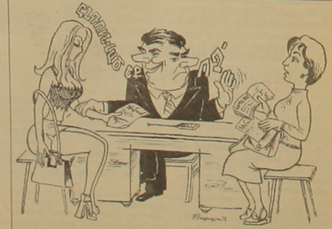
Ընղղում ենն 18-25 տարեկան աղղիկների, ողղեր տրաղղեղում են ժամանակակիղ բարեղերն: