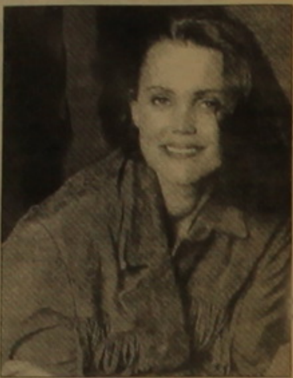
Ներգլուխի դառնալը, որոշել է վերափայլելու եւ արդեն ծայնագրում է նոր ալբոմի երաժշտական նյութը:

80-ականների ամենագեղեցկաեստ աստղերից մեկը՝ Բելինդա Կարլայլը, վերջերս բավական մեծակ գրույցով ներկայացավ VH1 հեռուստատեսի «Երաժշտության ետեւում» ծրագրում: Որոշ աղբարներ հավաստեցան, որ նրա գեղեցկ Բելինդայի առավել ինքն արժանիներն հնարավորություն կունենան ծանոթանալու «Փլեյբոյ» ամսագրի հաջորդ համարի ընթերցողները: Եվ երգչուհին, եւ «Փլեյբոյի» խմբագրությունը գերադասում են լուել այդ հարցին վերաբերող տղաների մասին: Սակայն նույնիսկ եթե «Փլեյբոյի» ընթերցողներն հիասթափություն է տղավում, դա չի տղառնում Բելինդա Կարլայլի բազմաաղաւ երկրազուններին, որոնք շուտով բազմաթիւ աղբարներ են ունենալու հիանալու նրա անվազն մեկ արժանիով: 80-ական բվականներին Go-Go's խումբը, որի անդամն էր Բելինդան մինչեւ մե-