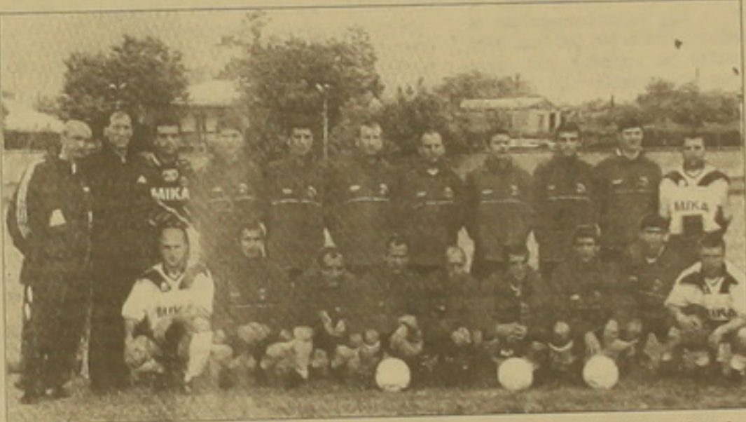
Հայաստանի գավաթակիր «Միկան»

Հայաստանի «Անկախության» գավաթի 9-րդ խաղարկության հաղթող դարձավ «Միկան»: «Միկա»-«Չվարթնոց» վճռական խաղը ժամանակացույցի համաձայն անցավ համաձայն, անգիշտության ընթացքով: Մա իրոք գավաթային խաղ էր, որտեղ առաջին րոպեից սկսվում էր ֆուտբոլիստների մարտնչությունը, հաղթանակի հասնելու սեյնը: Նման դեմոստրացիան ձգվում էր ակնկալել դիտարկման խաղ, քանի որ ժամանակացույցի մարզադաստի մարզադաստում անցկացված եզրփակիչ խաղը գրավիչ էր առաջին հերթին ժամանակացույցի լարվածությամբ: