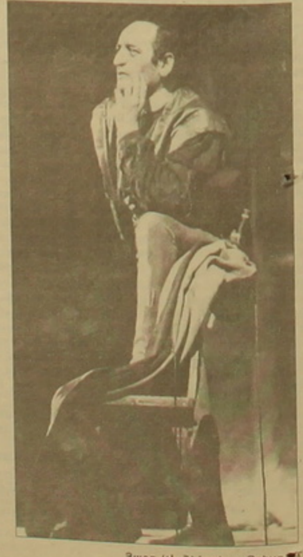
Յագո Գ. Երբային «Օրբելուն»