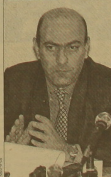
Մամն խնդիրները կարգավորում են ինձաբարաբար, Բանի որ այդ դեղում գործում է առաջարկի ու դաժանաբարի օրեմը: Մինչդես մեզ մոտ այս գոր-

Հայաստանում օգտագործվող էլեքտրաէրեւանի 98 տոկոսն արտադրում են մեր 5 խոտը ընկերությունները՝ ԱԵԿ-ը, 2 ՏԵԿ-ը եւ Սեւանի ու Որոտանի ՏԵԿ-երը: Մեր Երան փոքր է, եւ մրցակցության ձավալումն այստեղ նդասակահարմար չէ: Ըստ հանձնաժողովի նախագահի՝ այդ մրցակցությունը նդասակահարմար կդառնա միայն մեկ դեղում, երբ տարածաբանում զարգանա ինեսգրացումը եւ ձեռավորվի միասնական Երեւանի Երան: Երեւանի ոլորտի կարգավորման կարեւոր նախադաժաններից են սակազային Բողալականությունն ու լիցենզավորումը: «Բանի որ մատուցվող ձառադաժություններն այս ոլորտում ունեն մեքնաբարային բնույթ, դեսությունը դիտի կարգավորիչ դեր սամոձելի դաժողանելով սակազային կառույթությունը: Այլադես մրցակցության բացակայությունը կբերի սակազների անեղի բարձրացման: Դեսությունը դիտի նաեւ երաժիշիներ տա տեսվարող սուրբյեկներին նրանց գերե դաժելով անադար օրեմներից ու աԵրանային անբարեդաժության դաժաններից», եգրակացնում է հանձնաժողովը: Մրցակցային Երանում