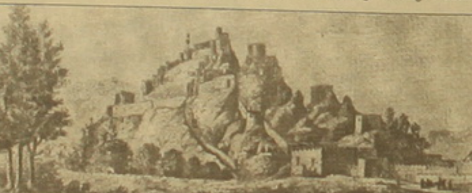
Վանի բերդը հյուսիս-արեւմուտից:

Վանում զսնվող զենքերայ Եկիկուտեւի գլխավորած զորաբանակը ռազմադասում առաջացած իրավիճակի կարակցությամբ կարողություն ստացավ նահանջել անդադարան թողնելով հայ բնակչությանը: Հրաժեշտ արվեց մեր ճանն ու անուշահամ մրգերով ծանրաբեռնված այգին, Այգեսանի այգուն՝ բռնեցիմ գաղթի հոգնասանջ, ոմանց համար