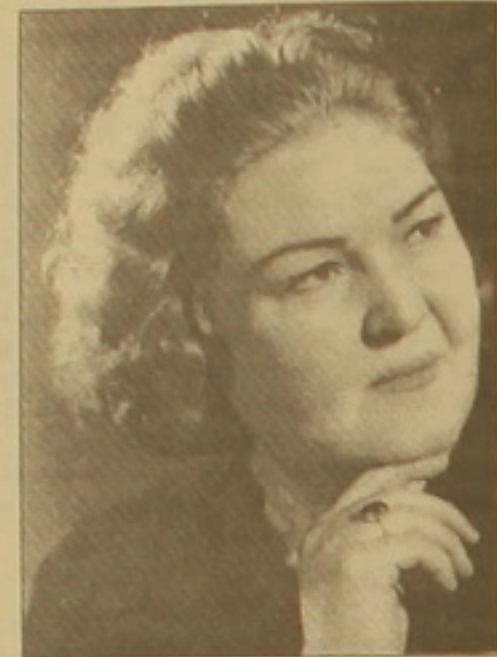
Ավա՛դ, բասրունի փակումից մինչև օրս, մի երկարամյա սահմանափակում, Ավա՛դը լույս է բերում իր լուսավորչական գործունեությանը...