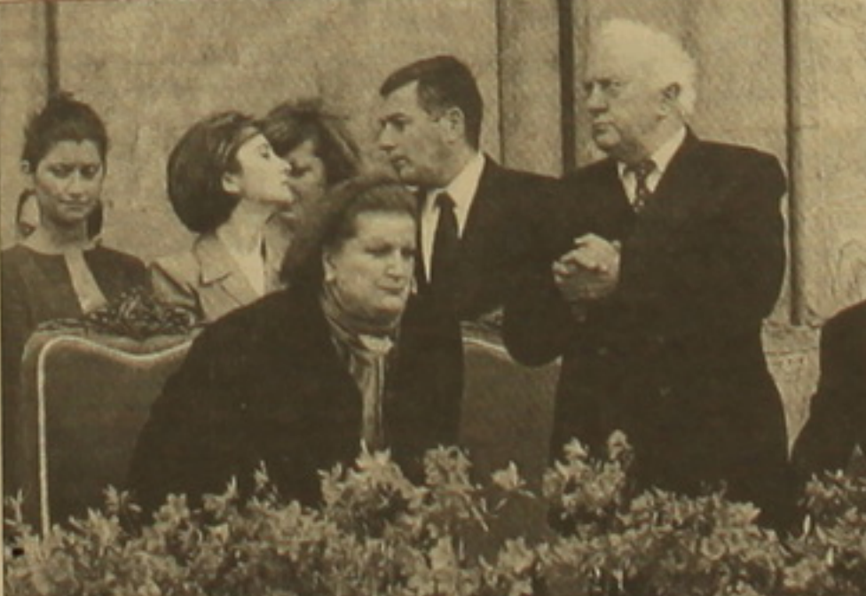
Նախագահ Շեարդնաձե՝ յուր սիկնոչ հետ

լու իր նախաձեռնության դրդադատախազները, ինչպես նաեւ հրապարակելու դատախազների դատախազական վերաբերմունքը դատախազության հանդեպ: Տես իջ 2