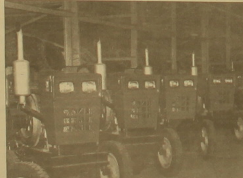
Հայաստանի կառավարության կողմից Հայաստանի կառավարությանը տեսանքով գործարանների հաշվին արհադրության 25 ծրագրով կարողությունը էՄ-320 մակնիչի 50 միկրոսակտրներ մարտի 30-ին հասցվեցին Հայաստան եւ այժմ գտնվում են «Լուսինու» ՊԲԲԸ-ում։

Ճաշարձայի կառավարության կողմից Հայաստանի կառավարությանը տեսանքով գործարանների հաշվին արհադրության 25 ծրագրով կարողությունը էՄ-320 մակնիչի 50 միկրոսակտրներ մարտի 30-ին հասցվեցին Հայաստան եւ այժմ գտնվում են «Լուսինու» ՊԲԲԸ-ում։ Ինչպես նշեց ծեծի ենթարկության փոխտեստեն Աստղայանը, վեց կողմեր ունեցող սեխնիկան (զուբան, կիսակցողի, խոհնիկի եւ այլն) առայժմ հավաքվում է, որը կավարսվի առաջիկա մի ամիս օրում։ Ի դեպ, նույն ընկերության դառնաւ սրահում գտնվում են նաեւ դեռեւ այս տարվա հունվարի վերջին շինասանից ստացված 78 (10-ը՝ 15, մնացածը՝ 20 ծրագրով կարողությունը) միկրոսակտրներ։ Աստղայանը մի ֆունկ օրը հետ ծեծի ենթարկություն այցելեցին ՀՀ վարչապետը, գլուխատեսության նախարարության դատարանական կողմից եւ հավաստագրին, որ ներկրված սեխնիկան կօգտագործվի առաջիկա գարնանացանի առաջատարներում։ Գարնանացանը սկսվել է, սակայն չգիտեմ ինչու առայժմ գլուխատես շինարարն անհրաժեշտ 128 միկրոսակտրներ կանգնած է «Լուսինու» ՊԲԲԸ-ում։