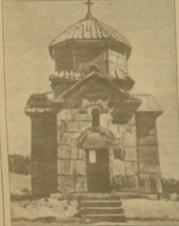
Այստեղ Աւարակի գերեզմանաքնը Վարմարի հաքահանուքայամբ գրողի գերեզմանն է: