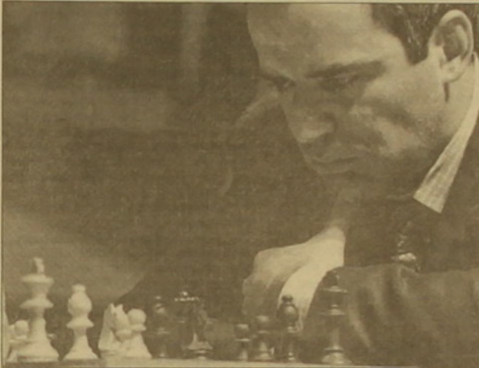
Վերականգնված է մտածում Գարրի Կասպարովը:

Որովհետեւ է, որ մրցախաղը տեղի կունենա Լոնդոնում, առաջին տարիս կանցկացվի հոկտեմբերի 9-ին: Մասնակիցները 16 տարիս կխաղան: Աշխարհի չեմպիոնի կոչումը տրամադրվելու համար Կասպարովին բավարարում է նույնիսկ հավասար 8-8 հաշիվը, իսկ այդ կոչմանը տիրելու համար Կրամնիկը տարավոր է ձեռք բերել առնվազն