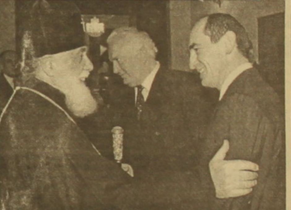
Տես թ 3

ՊԱՅՆԱԿ ԽՈՒՐՈՒՄԱՆ ԹԻՒՐԿԻԱ-ՎԵՐԿԱՆ Երեկ օրվա երրորդ կեսին ՀՀ նախագահ Ռոբերտ Բոչարյանը երկու- րյա այցից հետո վերադարձավ Վրաստանից: Թբիլիսիում նախագա- հի երկրորդ օրվա համընդհանրացի աճեմահասկանականը, թերևս, ՀՀ նախագահի ելույթն էր Վրաստանի խորհրդարանում արածածա- քանային համագործակցության մանրամասն ու բովանդակալից վերլուծությամբ: Իր ելույթով ՀՀ նախագահը դափնեհին տանադ- րեց «Վարավային Կովկասի մեր ընդհանուր տունն է, հիմնահարցերի բաց ու անկեղծ լինարկման»: Դեռ առաջին օրը ղրն Բոչարյանը մի քանի անգամ կրկնեց, որ հայ-վրա- ցական համակողմանի համագործակցության իրավական հիմքը կա, ստ- րագրված է դայմանագրերի ու համաձայնագրերի լուրջ փաթեթ, սակայն չօգտագործված մեծ ռեսուրսներ դեռ լան կան: «Որպես կանոն միջազգա- յին արքեր համաժողովներում ու հանդիպումներում Հարավային Կովկա- սի ղեկավարներս բավական ակտիվ արդյունք ենք մեր տեսակետները ար- ածածաքանային խնդիրների շուրջ: Ցավով տրտի, դժվար է այսօր արձանագ- րել նման ակտիվություն մեր հարեաններիս անմիջական լինարկումներում, դժգոհեց ղրն Բոչարյանն ու դարգարանեց Ալեքսանյ է, որ արածածաքա- նը մեծ հետախոնություն է ներկայացնում ինքնական ներուժի տեսակող- մից: