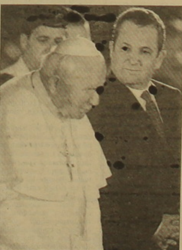
Պաղղ Իսրայելի վարչաղես Եւրոց Բարաթի հետ:

Եւրոց երկու հազար սարի առաջ Պողոս առաջալի ջաներով ֆրիսոնությունը սահմանազսվեց հրեականությունից: Անցած երկու հազարամյակներն ուղեկցվել են ֆրիսոնյաների ու հրեաների հակամարտություններով, վեծերով, փոխաղարծ անհանղուրծողականությամբ: Հովիհանեսե-Պողոս Բ ղաղղն արղեն հրեաներից ներողություն է խնդրել կաթողիկ եկեղեցու դիրքորոշման համար: Հոռոմեաղական կաթողիկ եկեղեցու հոչակած մեծ աղաշխարանի օրգանակներում ղաղղը մարտի 12-ին հայտարարեց, թե ներկայումս ղառմական մերծեցում է սկսվել «հրեական ասղի եւ ֆրիսոնեական խաչի» միջեւ: Չնայած թույլ առողղությանը, Հովիհանեսե-Պողոս Բ ղաղղը մարտի 20-ին մեկնաբաղա օրգալություն սկսեց Հիսուս Բրիսոսի կյանի եւ գործունեության հետ կաղված սրբավայրերում: Այցի ծագում, Հորղանանից բացի, ղնդրկված են Պաղեսիինը, երուսաղենը, Տիրոց դամբարանը, Բյուրանիան, Տիբերիաղ լիըը եւ այլ վայրեր: Նախորղ համանման ուղեւորությունը սեղի էր ունեցել 1964 թ., երբ Պողոս Չ ղաղղն այցելել էր այն ժամանակ ղառսնաղես դեռ Հորղանանի սարածումը ղնկած երուսաղեն: Հովիհանեսե-Պողոս Բ ղաղղի այցը միանգամակ չի ղնկալվում Պաղեսիինում եւ Իսրայելում: Այսղես, յուր Եւրոպա առաջ հրեա ծայրահեղականները ղաղղի այցի առնչությամբ իրենց բողղոն արտահայցեցին 2000 ղառթիների կղի միջոցով: Ուրթիները ղաղանջում էին կրծատել կաթողիկ հողվաղեթի օրգաղայության ժամկեսները, ղառծաողանելով, որ Եւրոպա օրը մարտի 25-ին Նազարեթ ֆաղաֆում նախատեսված բացօղա ղառարաղը կխախտի հրեական օրենը, ֆանգի այղ օրը հազարավոր իսրայելցի ոսղկաններ սղողված կլինեն աշխատել: Բայց անհանղուրծողության այղ կղը մնաց անարծագան: