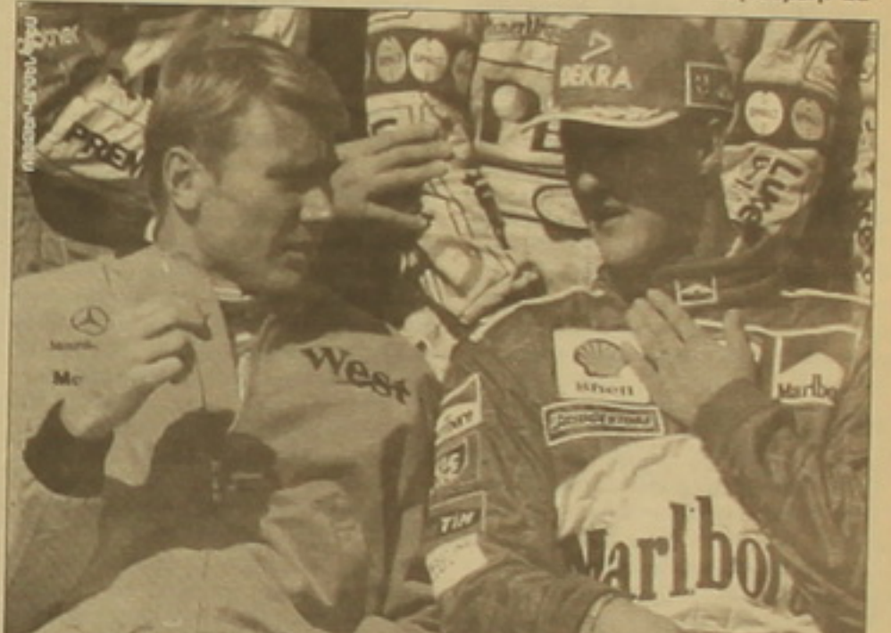
Ավստրալիայի կրկնակի չեմպիոններ Միկա Դալիերեն («Մալարեն») եւ Միխայել Շումպերը («Ֆորմ») այս անգամ եւս հաղթողի կոչման հավակնորդներ են: