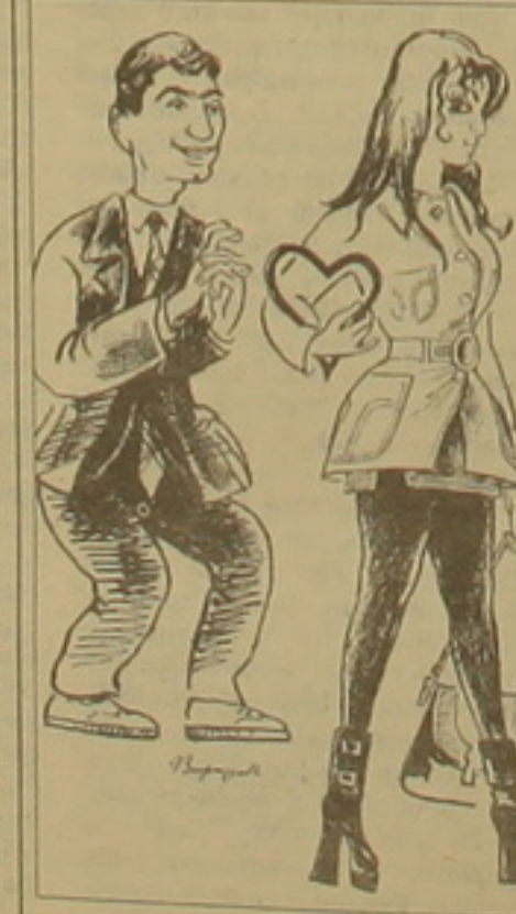
Մի օրս ունեն լեճից բարի