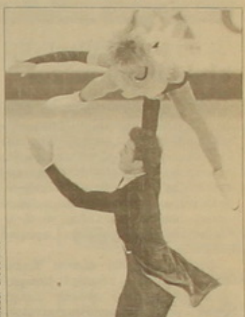
Երկու ղեկավարողների Ալեքսեյ Զապուդինի եւ Եվգենի Պյուլեյնկոյի միջեւ: Դենց նրանք էլ առաջատար են դարձել նախնական փուլից հետո:

Վիեննայում մեկնարկել է զեղասահի եվրոպայի առաջնությունը: Մրցումների մասնակիցների թվում են նաեւ Հայաստանի մեկնապատուցիչները: Արդեն 5-րդ անգամ աշխարհամասի առաջնությունում հանդես կգա Մարինա Կրասիլցեւա-Արսյուն Զնայկով սպորտային զույգը: Պարային զույգերի մրցաշարին կմասնակցի Տիֆանի Զայդեն-Վազգեն Ազոյան երկյակը: Ի դեպ, վերջին զույգը մարզվում է նաեւ մարզումները նախապես Լինչուլի եւ Գենդի Կարդանտովի գլխավորությամբ: Ավստրիայի մայրաքաղաքում ընթացող առաջնությունում հանդես կգա նաեւ մեծասահորդուհի Յուլյա Լեբեդեւան: Առաջին օրվա յայտարարեց հետո սպորտային զույգերի մրցումները գլխավորում են ռուս մարզիկները: Առաջին տեղում Մարիա Պետրովան եւ Ալեքսեյ Տիխոնովն են, երկրորդում՝ Ելենա Բեբեժովան եւ Անտոն Սիլաբուլովն: Տղամարդկանց մեծասահիերում լավագույն մրցակցություն է ստասվում