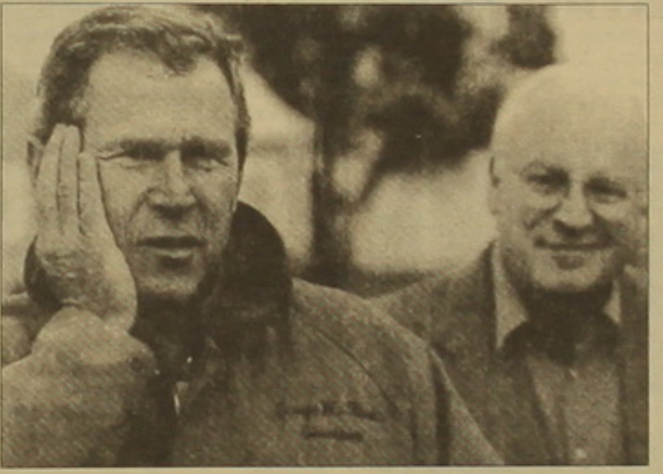
Ջորջ Բուլոկը եւ Դիկ Չեյնին

մաձայն, ժամը 17-ին դադարեցրեց հանձնաժողովների աշխատանքը: Երկուսուկես ժամ անց դատարանական արդյունքներն ստանալով Հարիսը հանրապետականների թեկնածու Ջորջ Բուլոկը կրկին հաղթող հայտարարեց 537 վեքի առավելությամբ (վերահսակարգող առաջ արժեքները 930 էր): Պալմ Բիչի հանձնաժողովն աշխատանքն ավարտեց ուժացումով ժամը 19-ին, դեմոկրատների թեկնածու Ալբերտ Գորի համար «հայթայթելով» 180 հավելյալ վեք: Սակայն այդ արդյունքը հաշվի չառնվեց: