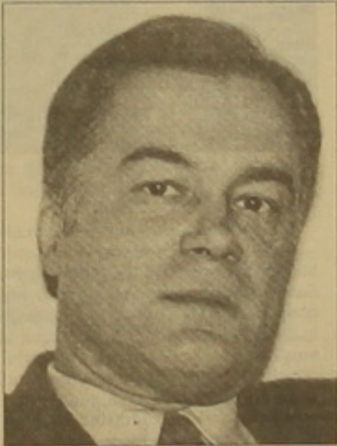
Բնական է, որ այս իրողությունն արձագանքում է լիարժեք հարաբերություններում: Նախագահ Սեֆանուկուի սանձաղկապ սարկազմաբարձր հարցազրույցը, որի արդյունքում էլ հարաբերություններում: Նախագահ Սեֆանուկուի սանձաղկապ սարկազմաբարձր հարցազրույցը, որի արդյունքում էլ հարաբերություններում:

Հայաստանում հունաստանի դեսպան Պանայոտիս Զոգրաֆոսի հարցազրույցը «Ազգին»