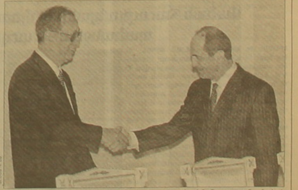
Չինական, ռազմասեփնիկական ուղերձներում: Որդեւս համագործակցության գործնական օրինակ, նա սովել է, որ Հրազդանի ՏԷԿ-ի 5-րդ բլոկի կառավարությունը հայաստանում մրցություն հաղթող է ճանաչվել չինական ընկերությունը: Խե Սյաոլվեյն իր հերթին տեղեկացրել է, որ հայ եւ չինացի գործարարներ ստորագրել են Հայաստանում փոխարկությունների արձագանքային համաձայնագիր: Չուցակիցները համոզումն են հայտնել, որ երկու երկրների կառավարությունների համաձայն ջանքերով հայ-չինական անտեսիստեսական կապերը նոր զարգացում կստանան:

Նախագահ Ռոբերտ Քոչարյանը երեկ ընդունել է Չինաստանի ժողովրդական Հանրապետության կառավարական լիարժեքությանը արձակուրդի անտեսի եւ տեսական համագործակցության փոխնախարար Խե Սյաոլվեյի զխավորությունը: Ինչպես հաղորդում է ՀՀ նախագահի մամուլ գրասենյակը, նա հանրապետության նախագահին հաղորդել է ԾԺՀ նախագահ Ղյան Ղեմինի ողջույնները: Ռոբերտ Քոչարյանը բարձր է գնահատել հայ-չինական հարաբերությունների ներկայիս մակարդակը եւ զարգացման միտումները նշելով, որ երկու երկրներն ունեն համագործակցության դեռեւս չօգտագործված մեծ ներուժ: Պարոն Սյաոլվեյն ընդգծել է, որ Չինաստանը լիարժեք է ընդլայնել եւ խորացնել անտեսիստեսական հարաբերությունները դրանց հաղորդելով նոր բովանդակություն եւ դիմադիմ: Ըստ հանրապետության նախագահի, երկու երկրները կարող են արդյունավետ համագործակցել փ