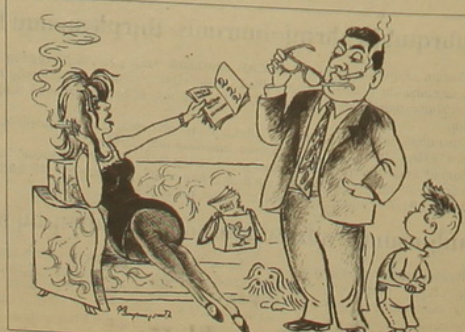
«Գնա գորոք եւ ասա քեք ուղիղ ես...»