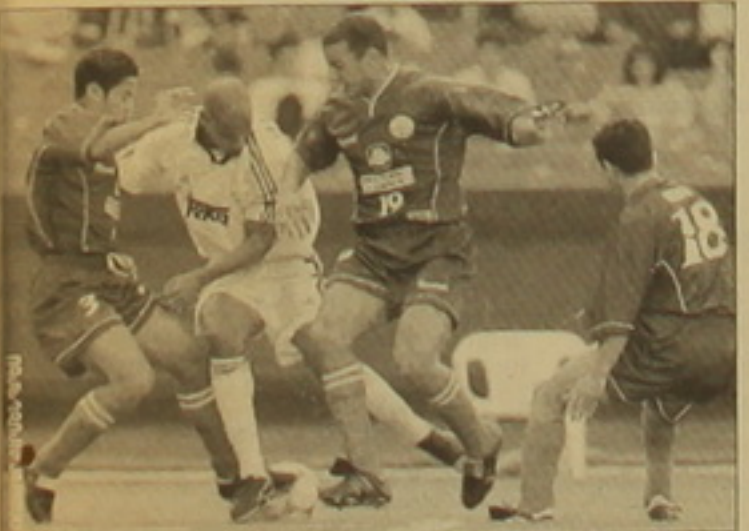
Պաի «Ռեալ» - «Ուզա» հանդիպումից

Բազմիշխյուն անցկացվող ակունբային թիմերի առաջնությունում որոշվեց եզրափակիչ խաղի առաջին մասնակիցը: Դա բրազիլական «Կորինտիանսն» է, որ խմբային մրցաշարի վերջին տուրում 2-0 հաշվով հաղթեց Մաուրոյան Մարադոնայի «Ալ Լասր» թիմին: Հաջիվը խաղի 25-րդ րոպեին բացեց Ռիկարդիոյն, իսկ 82-րդ րոպեին կրկնադասակեց Ռիկարդոն: Հենց այս հաշիվն էր բավարարում բրազիլացիներին, քանի որ նրան գնդակներ