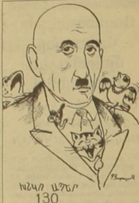
ՆՆԿՐ ԱՅՏԻ 130

Հարություն Կալենցի արվեստագետ, նրա արվեստի երկրպագուների մոտ բազմաթիվ գծանկարներ են դադարեցնում, որոնք այդպես էլ ավարտվում են սեփ ջուրեղան: Թվում է, թե հայտնության նման գեղանկարչին երեսացել են գույները ձեռք մեջ, ու նա Կալենցը միանգամից, ժողովրդումով ձեռք մեջ առնված գույները փոխանցել է կսավին: Գեղանկարչական բան ու բան աշխատանքների մասին դժվար է բացատրություններ գտնել: Կալենցի դարաշրջանում այս միտքը բանավելի հարմար է: Պարզապես տեսնում ես մի խորհրդավոր աշխարհ, որտեղ դու