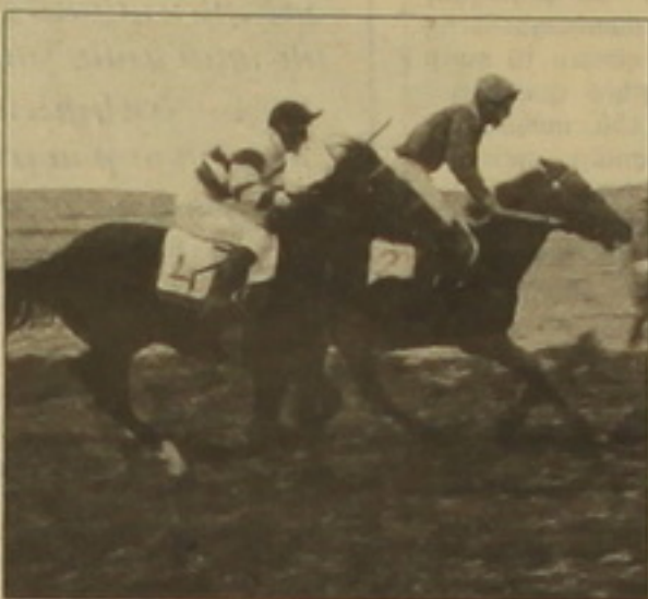
Գեղեցիկ լավագույնս հաղթահարեց «Այրուծի» հեծյալ ակումբի անդամ Կառլեն Նավասարդյանը: Բիվեն մոտոցով:

Էջիմածին Երանյանը 40 տարվա դադարից հետո մեկնարկեց ծիծերի մրցարանը: Ամենաբարձր գումարային մրցույթներն իրենց հետքն են դրել նրան, անցյալում մեծ ճանաչում ունեցած աստղերը այսօր Հայաստանում մոռացության է մատնված: Գեղեցիկ այդ ավանդույթը վերականգնելու նպատակով Երանյանը «Տարուն» ծիծերով ակումբի համալիրի եւ «Այրուծի» հեծյալ ակումբի համատեղ ջանքերով հայ ծիծերները առաջին մրցարանի ականատեսը եղան: Հավակնաբեկ իրենց վարձով հիացրեցին «Տարուն», «Այրուծի», «Չափակ» ակումբների 16 ու անհաս մարզկանց 8 ծիծեր: Վազգույնի նախադասարանները երկու կազմակերպիչի մեկ ամսվա աշխատանքի արդյունքն ունեն: