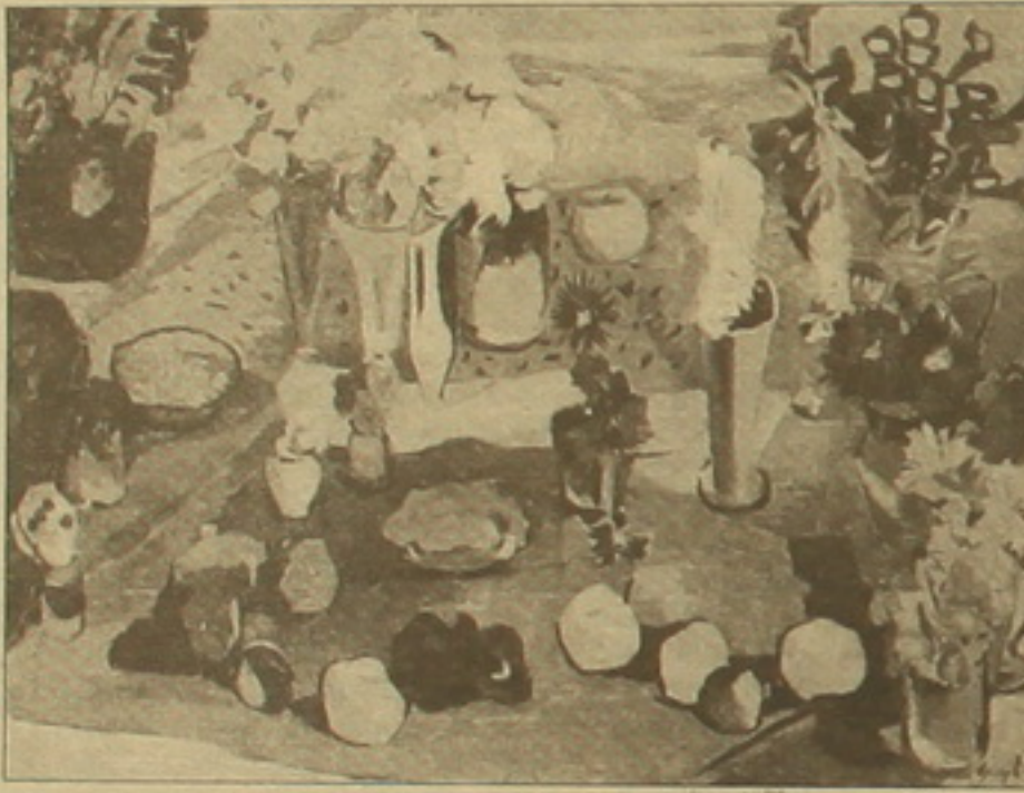
Հարություն Կալենց «Նախաճաշ», 1960 թ.

Ես կյանքի սկիզբը եղավ որբերգական հինգ տարեկանում, եղեռնի դաժան սողանդում, կորցնում է մորը: Այդ կորուստն անքննելի հետք է թողնում նրա ողջ կյանքի վրա, մոր կերպարը, մոր դեմքը միշտ ցուլացել է նրա աչքի առաջ, այդ կորուստն էլ նրան դարձրեց այդպիսի քախտոս ու այդպիսի մեկուսի աշխարհում... Այս տիպի սկզբից հետո աղափնեղ կարելի է, թե ինչպես կանցնեն տարիներ, որ այս մտայն հոգին աշխարհին կենդանի ահա այսօր էս լինելուց զուրկ լինի: Կուրացուցիչ մի հրավառություն, երբ այլև չի հասցնում ուսուցիչ, իսկ միտքը հասկանալ, թե ինչ է կատարվում կսավի վրա... Գեղեցիկի զգացողությունը սովորելի բան չէ, դա լիցի լինի էն զվից...»