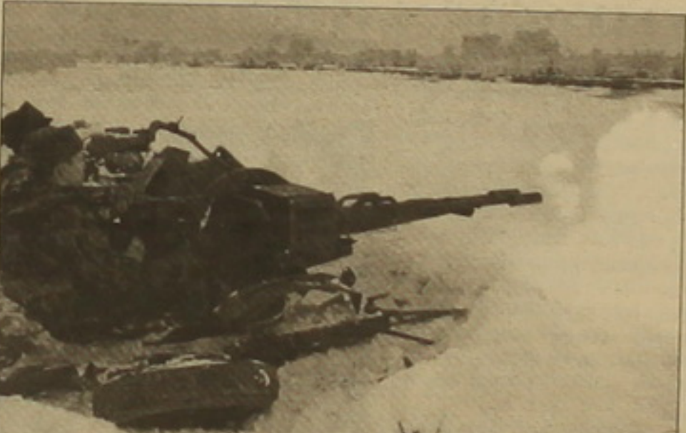
Ռուսները չեն ուզում... «վազը թամբել»

Ռուսներին էլ չի հաջողվի: Ավա՞ղ, սկսեց Օլբրայթի այս ղաճակերաղոր արճա- հայտությունը վկայում է միայն, թե նա որքան վաճ ղիճե... հաղ ճողղուղղա- կան բանաղիոխությունը, կոնկրեճե՛ մեր հանրահայտ «Զաղ նաղար» հեղիաղը: Մինղեւ ղուսները, ինղեւս երեւում է, այղ հեղիաղը լաղ են «ղուրաղերէլ»: Ինղու՛ «թամբել», եթե կարելի է... տղանել: Մղանված վաղբից էլ ավե- լի անվնաս կենղանի՛: