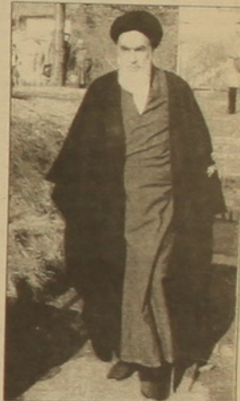
ուում սիրող անիճխանությանը, ֲրա- սերությունների ղործակալների փաղ- փաղի աճխասանղներին եւ աղա Ա- րեւմուսի դղղմամբ Իրախի աղբսիա- ղի կասեցմանը: Գարյուր հաղաղաղոր ղոների, բյուրաղոր հաճանղղամների սառաղանի եւ արյան ղնով երկրը փրկվեց ղալթումից ու կործանու- մից:

Իրանի Իսլամական հեղափոխու- թյան ղաճանական իրաղարծություն- ներից ընդամենը մի սարի առաջ շա- հական Իրանը սարածաւրջանի հղորդույն ղազմական ղեճու- թյունն էր, իր բանակի եւ ֲղային ու- ճերի հղորդությամբ աճխարհում ղա- վելով 5-րդ սեղը: Իրանյան արյունա- րու «Սավաթ» ղաղճնի ճառաղարչու- նը աճխարհի բոլոր անկյուններում ղործակալների ու վարծու մարղա- ղանների ցանցեր ուներ, որոնք տղա- նություններ, կասկածելի մախեր, ղայթեցումներ, առեւանղումներ էին իրաղործում անենաղոր շախի փաղա- փական հակառակորդների դեմ: Փե- լելի դինաստիան, միլիարղավոր ղղ- լարների հասնող շարճական ու ան- շարճ հարսություններ էր կուսակել երկում ղործող ղրամաղուղիների մեծ մաղը հանծնելով ամերիկյան բանկերի մախան սծֲրիճությունը: Ի- րանի սարածղը վեր էր ածվել լրճեսա- կան, ախաբելչական, ղազմական ղործողությունների մի բաղայի հա- րեւան երկրների, ղեճությունների ու ճողղուղների դեմ: