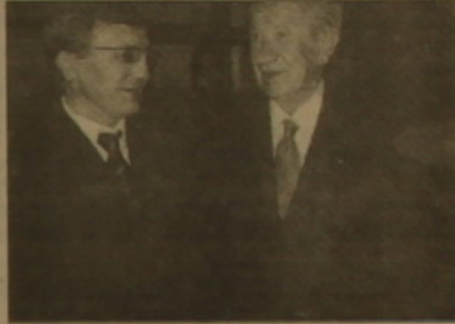
Չրույցի են բռնվել Բենուր Փաւայանը եւ Խուան Անտոնիո Մամարանչը:

Հայաստանի ազգային օլիմպիական կոմիտեի նախագահ Բենուր Փաւայանին եւ գլխավոր ֆարսուդար Նւան Մուսնյանին ուղղված հեռագրում Միջազգային օլիմպիական կոմիտեի նախագահ Խուան Անտոնիո Մամարանչը շնորհավորել է մեր օլիմպիական կազմակերպությանը՝ 27-րդ օլիմպիական խաղերի ավարտի առթիվ: