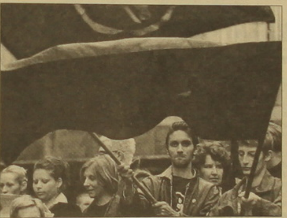
Սերբիայի խորհրդարանի նախագահ Միլան Միլուտինովիչը (մեջ) և նրա կողմնակիցները:

դարանի առջեւ՝ դաժանացելով մասնավորապես համալսարանական օրենքի բարեփոխում: Ի վերջո խորհրդարանը տեղի սվեց: Միլոեվիչի վերջին նեցուկը հանդիսացող Սերբիայի նախագահ Միլան Միլուտինովիչը, որին Միջազգային քրեական դատարանը մեղադրում է (ինչպես Միլոեվիչին) Կոսովոյում ռմիներ գործած լինելու մեջ, անձամբ հայտարարեց, որ ժողովրդի դաժանացին համադասախան ղեկսեմբերի 19-ին կանցկացվեն օրենսդիրների վաղաժամկետ ընտրություններ: