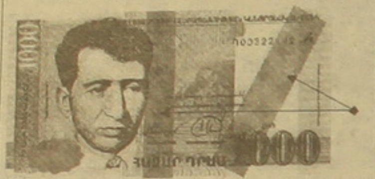
ՆԿԱՐ 2 Ենթակա են ընդունման բանկերի կողմից

Մաշված դրամի հետ խնդիրներ չունենալու համար անհրաժեշտ է իմանալ, որ հայկական դրամի վճարունակության հաս-