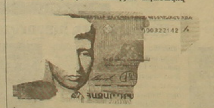
ՆԿԱՐ 3 Ենթակա են ընդունման ՀՀ կենտրոնական բանկի կողմից հեռագա փորձաքննության նպատակով

Երրորդ խմբի մեջ են դասակարգվում ավելի «ծանր» վիճակում հայտնված թղթադրամները: Դրանք զգալի մասը կորցրած կամ իսկության վերաբերյալ կասկած հարուցող դրամ-