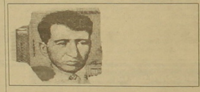
ՆԿԱՐ 4 Անվճարունակ են

Եվ վերջին խմբում բոլորովին անդեմաքանց անվճարունակ դարձած թղթադրամներն են, որոնք ենթակա չեն ընդունման եւ փոխանակման ոչ ֆիզիկական եւ իրավաբանական անձանց, ոչ էլ բանկերի եւ ՀՀ ԿԲ-ի կողմից: Այսպիսով, այլեւս անվճարունակ են այն թղթադրամները, որոնց մաշվածության արդյունքում չի դատաճանվել դրամի ակնհայտորեն 60-ից ավելին, Իսկ ու դրանք բնականաբար կորցրել են որոշ դատաճանական եւ իսկությունը բացահայտող հասկանիչներ: Նույն է վերաբերում նաեւ այն դեղմերին, երբ դատաճանված եւ ստանձված են չարքեր թղթադրամների մասեր: Անվճարունակ են համարվում եւ վճարամիջոց չեն կարող հանդիսանալ նաեւ մարման նշաններով երկու անցնող դակված, կամ «ՆՄՈՒՇ» մաշվածությանը դրամները (Նկ. 4):