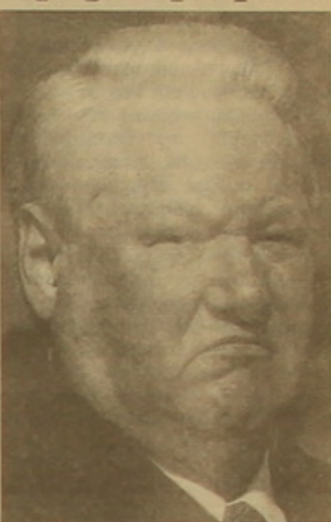
Նաղովար ժամանակահատվածն էր»:

Իր վերջին տարիների սկանդալներից հետո Ելցինը փորձում է դասական անձնավորության կերպար ստեղծել: «Արզունեսի Ի Ֆակսի» թերթին արած հայտարարության համաձայն, ինչն ուզեցել է դասնել իր նախագահական երկրորդ ժամկետի մասին, որը նրա ֆաղանական կենսագրության «ամեն-