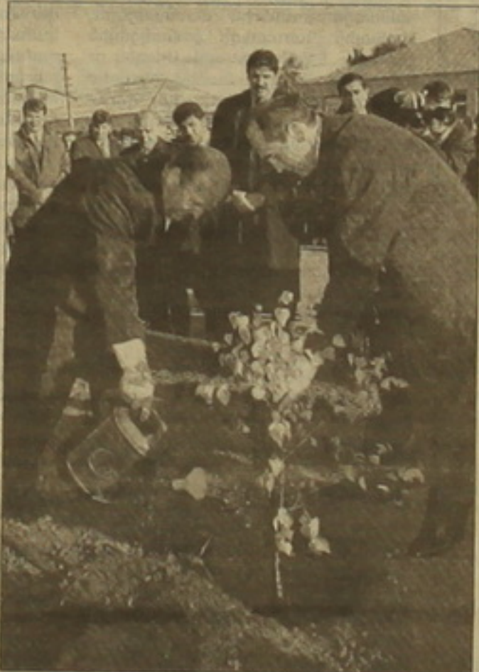
Թավալները, եւ կստեղծվեն նոր աշխատանքներ:

Հայաստանի Ռուսաստանին 113 մլն ԱՄՆ դոլարի դաշնային առջուկում Ռոբերտ Բոչարյանը նշեց, որ կար համատեղ ձեռնարկության ստեղծման խնդիր, իսկ մոսկովյան հանդիպումների ընթացքում ավելի կոնկրետություն է մտնում, եւ ռուսական կողմը համատեղ ձեռնարկության մաս կկազմի դաշնով: Տնտեսական բնագավառում ձեռք են բերվել մի շարք լուրջ լուծումներ: Մասնավորապես, ինչպես նշեց 33 օրյա շաբաթապահը, լուրջ լուծումներ են եղել սարի առաջ ադամանդների մասին հայտնի դաշնային մարտի կոչելու դեմում եւ կանգնած ադամանդների մասին հայտնի դաշնային մարտի կոչելու դեմում: