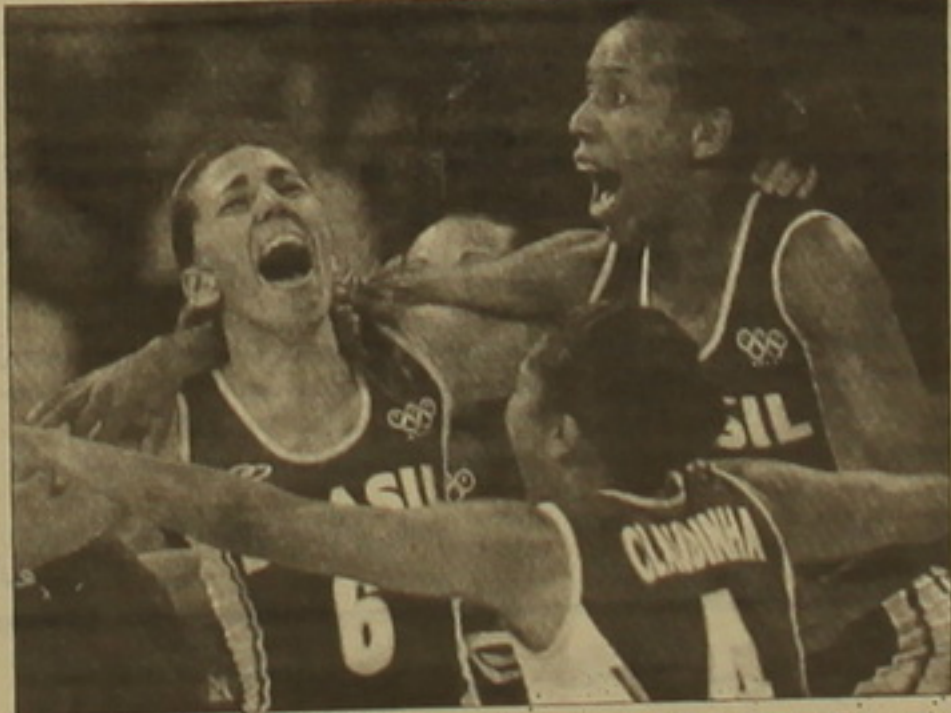
Բրազիլիայի հավաքականի բասկետբոլիստները ցնծում են: Զիջ առաջ օլիմպիական խաղերի բասկետբոլի մրցաժամանակում նրանք 68:67 հաշվով հաղթել են Ռուսաստանի հավաքականին: