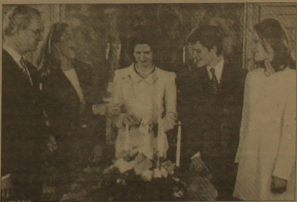
Ըվեղիայի արտաքին ղեկավարները

Արդեն 190 արի Ըվեղիայում անխ-ոռով իշխում է Բեննադոնների գաժա-սոնը: Բայց վերջերս կասկածներ են հայտնվել, թե միադեղությունը մոտա-կա արհմիություն կարող է վերանա-լ: Սովետական օրերս տեղի ունեցավ Ըվեղ սոցիալ-դեմոկրատներին մոտիկ կանգնած ԼՕ խոռո արհմիութեա-կան կոնֆեդերացիայի համազումա-րը, որտեղ, առաջանմանակի կր-ձասման եւ դրամական միության հարցերից բացի, նկատվում էր նաեւ միադեղության աղաղայի հարցը: Արհմիութեան կոնֆեդե-րացիան համազումարի ավարտին հասույթ հայտարարությամբ Ըվեղիան