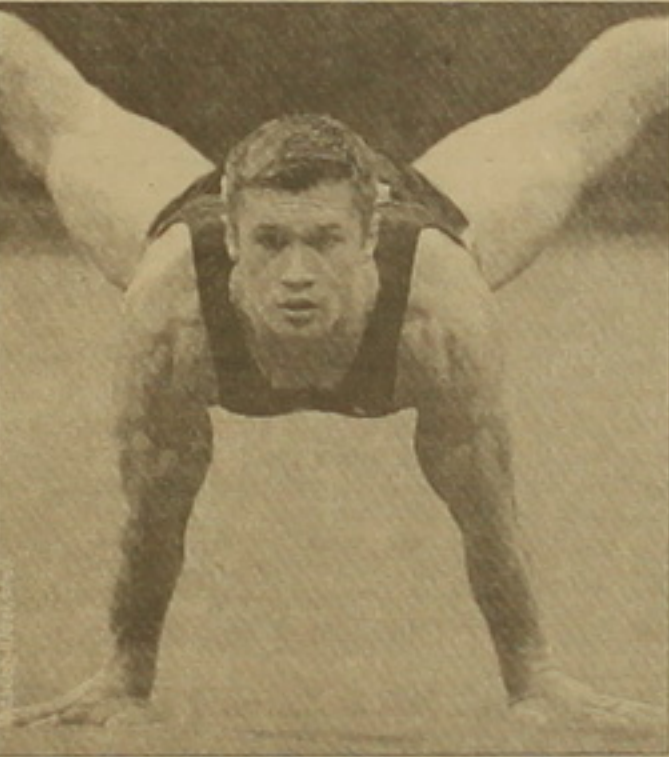
Ռուսաստանի մարմնամարզիկների առաջատար Նեմովը

Մեծ հետաքրքրությամբ էին սպասվում մարմնամարզության շղամարդկանց քիմային մրցումները: Գլխավոր ֆավորիտները Ռուսաստանի ներկայացուցիչները, որոնք մի քանի օլիմպիական շաղկապով չեն մտնում էին ճանաչվել, այս անգամ դարձան կրեցին: Օլիմպիական չեն մտնում դարձավ Չինաստանի հավաքականը, երկրորդ տեղում է Ուկրաինայի, երրորդը՝ Ռուսաստանի հավաքականը: