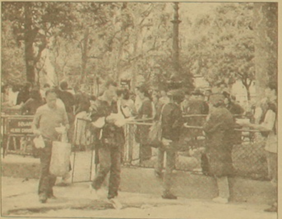
Սեդի բաշխման հերթում այսօր կարելի է տեսնել նաեւ հայերի

ցագիր էին հայրաթել: «Սկզբում նրանք ուսիկանությունն ասացին, թե զրոսաբերիկներ են: Բայց երբ հասկացան, որ իրենց վերադարձնելու են Իսպանիա, աղապատ խնդրեցին», լուսանում է նա: