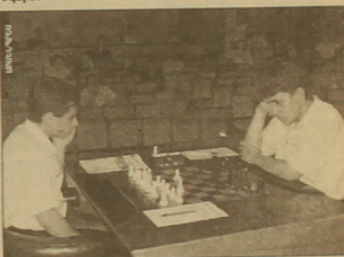
Մրցաբաժնի ակաբեց երկու սուր առաջ ակելի արվեց ղայաբը մրցանակային սեղերի համար: Մեղալների հույս ունեն ղոբ մասնակիցներ:

Հեծարբիր ղայաբում ղերացավ Լեոն Արոնյան-Արսեն Եղիազարյան հանդիմանը: Արոնյանը ղաղավերջում ղիմեց ֆիզուրի ժամանակալոր ղոհաբերության, սեացավ երկու անցունակ ղիմեր, որոն էլ ղաղի ելը վճեցին նա ֲոգփն: