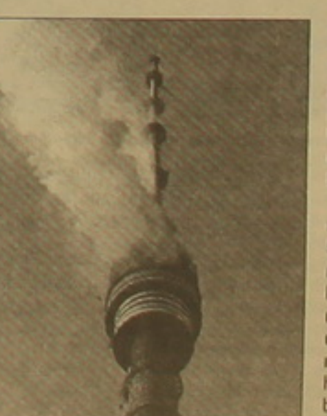
Միակային մի մասը տեղադրվել է հրդեհային անվտանգության կանոնների խախտումներով: «Պեթ ԵՆՏՐԱՅԻՆ»-ի Օսանկինոյի առարկը մոտավորապես 30-ով «գերբեռնված» էր

ՄՈՍԿՎԱ, 28 09 ՆՍՏՈՍ, ԱՆՅՅԱՆ. ՍԱՊՆ. Ռուսաստանի նախագահ Վլադիմիր Պուտինը գտնում է, որ հրդեհ Օսանկինոյի հեռուստաառարկում «հերթական արտակարգ զբոսաշրջություն» է, որ ցույց տվեց, թե ինչ վիճակում են գտնվում կենսական կարևոր օբյեկտները ոչ միայն Մոսկվայում, այլև ողջ երկրում: Ըստ նրա, միայն ցնեխական զարգացումը կարող է կանխարգելել նման միջադեպերը: Ըստ հեռուստաառարկման ղեկավարության ներկայացուցչի, Մոսկվայի վրա հրդեհից դեռ չի որոշված եւ վաղ է խոսել հեռուստաառարկի վերականգնման մասին: