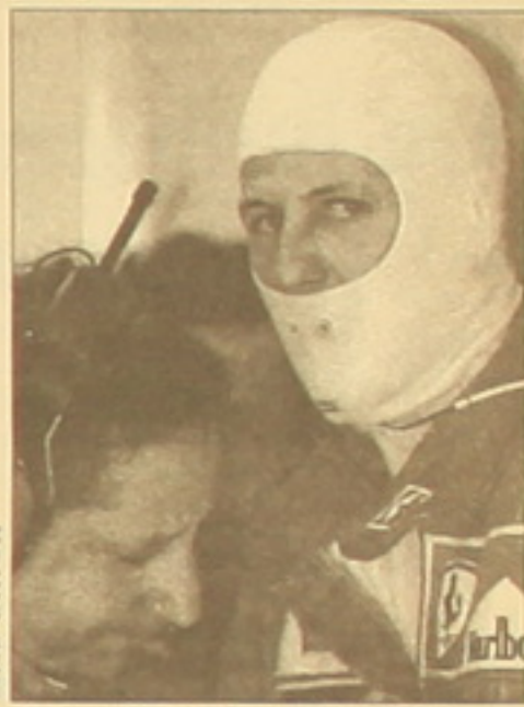
ՄԱԽԱՐԵ-ՄԵՐՍԵԴԵՍ ները ունի 64, Երեւանը՝ 62, Կուլս-հարը՝ 58, Բարիկեյուն՝ 49 միավոր: Կոնստանդնուպոլի գավաթի հավաքում առջինն է «Մախարե-Մերսեդեսը»՝ 112 միավոր: Միայն 1 միավորով է եւս մնում «Ֆեարին»: Առաջնության ավարտին 5 փուլ է մնացել

Հենց այս մարզիկներն էլ առաջին տեղերն են զբաղեցնում ընդհանուր հավաքում: 12 փուլից հետո Հակի-