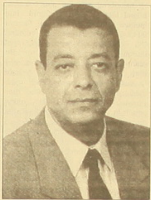
ՀՀ-ում Եգիպտոսի դեսպան Բակր Ռուեյի ալ Ամարին

1952 թ. հուլիսի 23-ը Եգիպտոսի արդի դեմոկրատիայի անկունադարձային իրադարձություններից մեկն է: Այդ օրը Եգիպտոսի ժողովուրդը առաջին անգամ սիրացավ 2300 տարիներ ի վեր կորցրած անկախությանը: Վերջ գծավ օսմանյան-ալքանական վերջին դինաստիայի խայտառակ ներկայացուցիչ Ֆարուկ թագավորի իշխանությունը: Եգիպտոսի հեղափոխությունը ղեկավարած «Ազադ սոլաները», արաբ ժողովրդի ռազմական ու քաղաքական մեծագույն ղեկավարներն էին: Քամալ Աբդ ալ Նասերի գլխավորությամբ, դեմոկրատիայի սխուր հուշ դարձրեց օսմանի գերիշխանությունը: