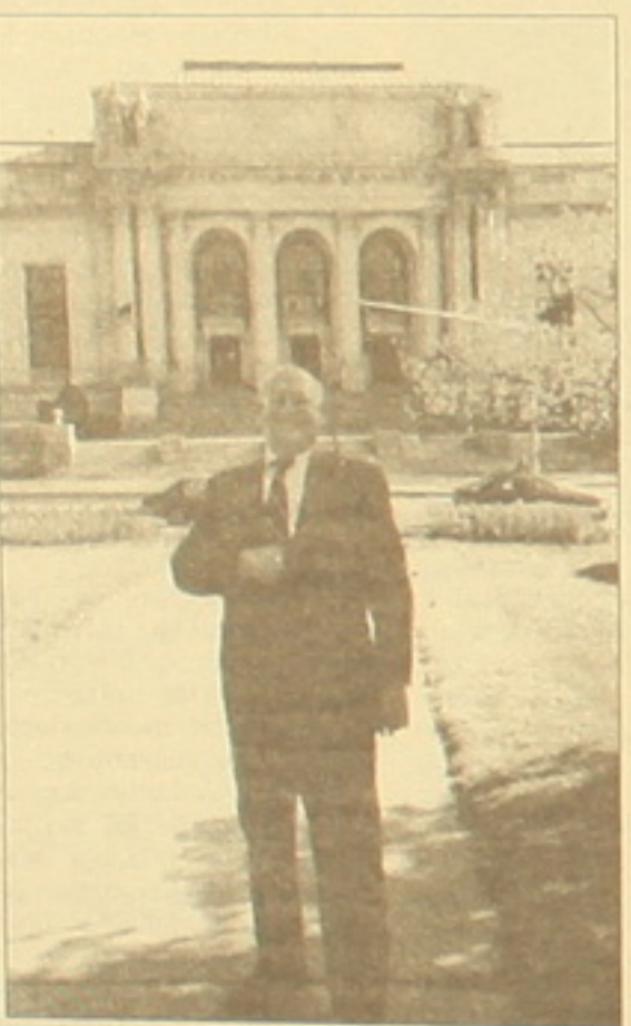
Տեղեկատվության ազատության կոմիտեի նախագահ Միչել Փրըման

Տեղեկատվության ազատության կոմիտեի ստեղծման գաղափարակիրը Մեյվ Քոլինգն է, որը երկար ժամանակ եղել է Դոււրբիի «Նյու քայմս» թերթի խմբագիրը: 1955 թ. այս նախաձեռնողը նա սկսել է հավաքագրել մյուս հասարակիչներին: Նրա 20 տարվա ցանկերն արդյունք չսվեցին մինչեւ Ուորթերգեյթի աղմկահարույց դասմությունը, ինչն էլ հանգեցրեց օրինագծի միաձայն ընդունմանը եւ այս հանձ-