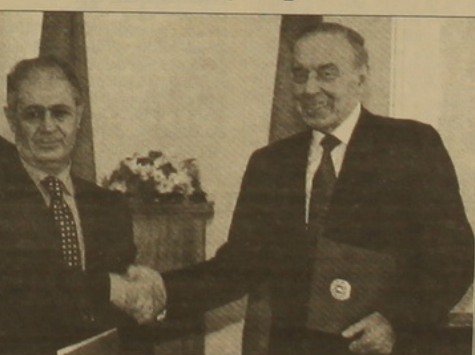
Թուրքիան ամենայն աջակցություն կցուցաբերի Ադրբեջանին իր արդար դատարանին, ասել է նախագահ Սեզերը:

ԲԱՍՏՐ, 12 ՅՈՒՆԻՍ, ՆՈՅՅԱՆ ՏԱՊԱՆ: ՏՆՏեսական համագործակցությունն ու անվտանգությունը Կովկասում հնարավոր են միայն այդ սարածաբանում խաղաղության եւ կայունության իրավիճակում: Այս մասին Բախլում հայտարարել է Թուրքիայի նախագահ Ահմեդ Նեջդեթ Սեզերը՝ հուլիսի 12-ին ելույթ ունենալով Ադրբեջանի խորհրդարանում: Ըստ նրա, դրան են նույնատեսակությամբ Թուրքիայի եւ Ադրբեջանի նախաձեռնությունները Կովկասում կայունության եւ բազմակողմ համագործակցության դաճանակի ստեղծման վերաբերյալ: Թուրքիայի ղեկավարի կարծիքով, սարածաբանային անվտանգության ճանապարհին լուրջ խոչընդոտ է շարունակում մնալ դատարանի խնդիրը: Թուրքիան կողմնակից է հակամարտության կարգավորմանը բանակցությունների ճշմարտարոճ Ադրբեջանի արժանիքներին: