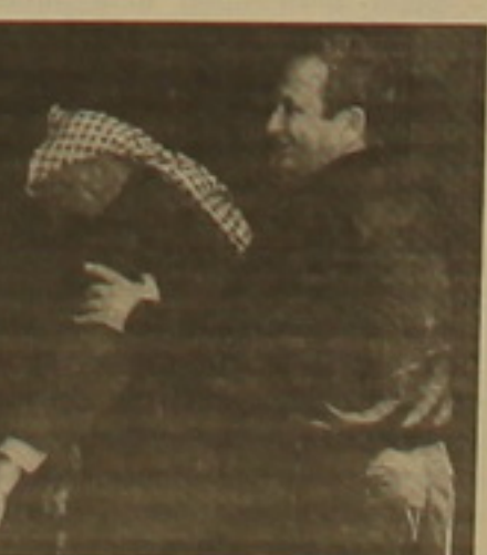
Կարգավիճակը, Պաղեստինյան դատարանի վերջնական սահմանների ճշումը եւ դաշնակցության փախսականների վերադարձի գրաֆիկը:

ՎԱՇԻՆԳՏՈՆ, 12 ՅՈՒՆԻՍ, ՆՈՅՅԱՆ ՏԱՊԱՆ: Քենի-Դեյվիդուն շարունակում են Իսրայելի վարչապետ Եհուդ Բարակի եւ դաշնակցության առաջնորդ Յասեր Արաֆատի բանակցությունները ԱՄՆ նախագահ Բիլ Կլինթոնի միջնորդությամբ: Բանակցությունների առաջին օրվա ավարտից հետո ամերիկյան դատարանական անձինք ճեղ են բարյազակամ մթնույրսը բանակցությունների սեղանի շուրջ, սակայն հրաժարվել են որեւէ մանրամասն հաղորդել: Ինչպես հաղորդում է BBC-ն, բանակցությունների կուլիսներում դաշնակցության կողմի մի ներկայացուցիչ բողոքել է Իսրայելցիների ամբարտանալ վարձագծից, իսկ նրան, իրենց հերթին, մեղադրել են դաշնակցությունների բռնության ստառնալիի բորբոման մեջ: Խոչընդոտության ճանապարհին լուրջ խոչընդոտներից են մնում Երուսաղեմի