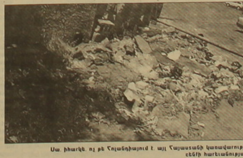
Սա, իհարկե, ոչ թե Հոլանդիայում է, այլ Հայաստանի կառավարության երեւի հաբեւանությունը:

Անցյալ տարի եղա Հոլանդիայում: Առաջին անգամ էի Արեւսյան եվրոդայում: Շրջեցի, հնարավորին չափ ծանոթացա հոլանդացիների միտ ու կացին: Այցելեցի տեսարան վայրեր: Շատ քան ինձ դյուրեց, հիացրեց, բարի նախանձով լցրեց, թե ինչու իմ հայրենին այդդես չէ: Եսալ ի՞նչն էր ամենից առաջ հիացնում անբասիր մաքությունն ամեն ինչում եւ հոլանդացիների անսահման հայրենասիրությունը, նրանց ազգային արճանադատությունը: Հոլանդիան զսնվում է Անգլիայի, Ֆրանսիայի, Գերմանիայի աւիարիի երեւի գորդեսությունների միջեւ: Սակայն այնեղդ եւ չեսա օտարալեզու ցուցանակ: Այդ ժամանակ ես ցավով էի հիւում երեսանը, որը լեփվեցուն է այլալեզու ցուցանակներով, որեւղ արհամարհված է հայրենիքը, եւ մի դառնության, ցավի եւ զգովանի ալիք էր բարձանում այն օտարաճու հայրենի սկասմամբ, որով իրենց հայրենիքում, իրենց հայրենիքի մարաֆադում, իրենց խանութների կամ մեռնարկությունների ճակագների փակցում են ռուտերեւ կամ անգլերեն, երեւմն տատախալով, ռաս հաճախ անհեթեթ ցուցանակներ, այն ողորմելի հույսով, որ օտարալեզուներն այդ ցուցանակներից հմայված