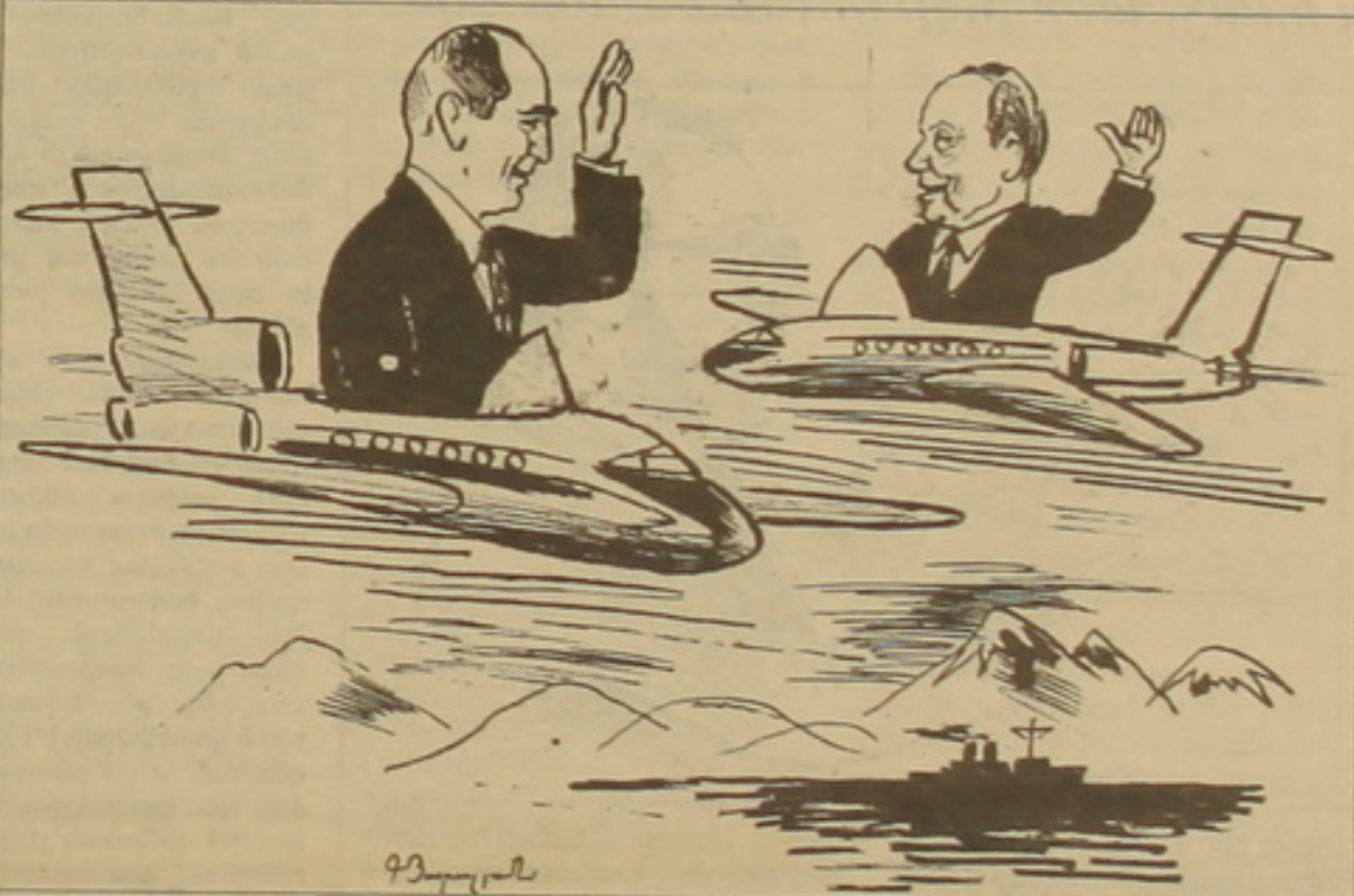
Ալիեւը մեկնեց Ավստրիա