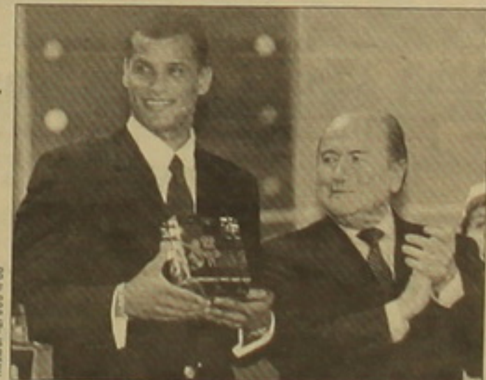
Մարզախերտերին հիշեցնենք, որ աշխարհի լավագույն ֆուտբոլիստների ընտրություններն անցկացվում են 1991 թվականից: Անա բոլոր տարիների դափնեկիրների անունները:

Երկուսրորդ օրը Բեյլիայի մայրաքաղաք Քրյուսելում կայացավ 1999 թ. աշխարհի լավագույն ֆուտբոլիստի մրցումը: Այս անգամ ՖԻՖԱ-ի հարցմանը մասնակցեցին ավելի քան 140 երկրների մասնագետներ: Նրանց մեծ մասը ծայր էր սվել իտալական «Բարսելոնի» քրազիլացի հարձակող Ռիվալդոյին: Նա 543 միավոր է հավաքել՝ զգալիորեն առաջ անցնելով մյուս հավակնորդներից: Բրազիլացի գերաստիկն հանձնվեց գլխավոր մրցանակը: