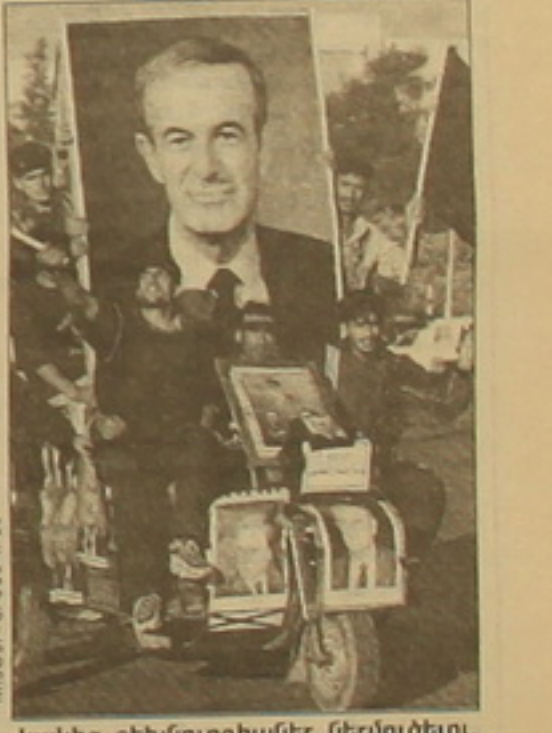
Բաւար Ասադը ծնվել է 1965 թ.: Նա Լադախական բաւարներում ի հայտ եկավ 1994 թ., երբ ավստրալիացի զոհվեց նրա մեծ եղբայր Բաւարը, որը ժառանգելու էր հոր դասակարգը: Այն ժամանակ Անգլիայում մասնագիտացող Բաւարը, ընդհատելով ակադեմիական ուսումը, վերադարձավ Դամասկոս: Այս արհեստներն նա ստանձնել էր շարաւախումների դեմ դասակարգելու, ժամանակակից տեխնոլոգիաներ ներմուծելու, ինֆորմացիայի համակարգեր կիրառելու եւ, վերջապես, հարեւան կիրառանի թրքաժառանգելը: Միեւնույն ժամանակ, նա դասակարգում մի քանի կարեւոր այցեր է կատարել արաբական մի ԵՊՀ երկրներ եւ Զրանսիա: Այստեղ, անկասկած է, որ շուկային արաբական աւախադը համարվելու է եւս մի երիտաւար ղեկավարով՝ ի դեմս Բաւար Հաֆեզ Ասադի:

Միջազգային վախճանված նախագահ Հաֆեզ Ասադին կիտխարիսի որդին՝ Բաւար Ասադը ծնվել է 1965 թ.: Նա Լադախական բաւարներում ի հայտ եկավ 1994 թ., երբ ավստրալիացի զոհվեց նրա մեծ եղբայր Բաւարը, որը ժառանգելու էր հոր դասակարգը: Այն ժամանակ Անգլիայում մասնագիտացող Բաւարը, ընդհատելով ակադեմիական ուսումը, վերադարձավ Դամասկոս: Այս արհեստներն նա ստանձնել էր շարաւախումների դեմ դասակարգելու, ժամանակակից տեխնոլոգիաներ ներմուծելու, ինֆորմացիայի համակարգեր կիրառելու եւ, վերջապես, հարեւան կիրառանի թրքաժառանգելը: Միեւնույն ժամանակ, նա դասակարգում մի քանի կարեւոր այցեր է կատարել արաբական մի ԵՊՀ երկրներ եւ Զրանսիա: Այստեղ, անկասկած է, որ շուկային արաբական աւախադը համարվելու է եւս մի երիտաւար ղեկավարով՝ ի դեմս Բաւար Հաֆեզ Ասադի: