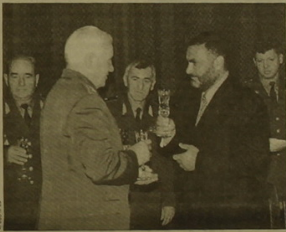
ՏԵՄ ԻՊ 3

Նախարարները մայիսի 20-ին Երևանում կառավարության ընդունելությունների շնորհիվ զուգահեռ հերթական նիստը օրակարգում էին հրատարակելու յոթերորդ օրը: Ինչպես էր ԱՊՀ