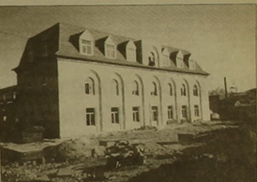
վանից հիմն ունենալ սեղում, ազդեցություն զարգացման ոլորտների վրա:

Առևտրաարդյունաբերական կոմպլեքսի առաջին մասնաճեղում, ինչպես ասվեց, կլինի 20 սենյականոց հյուրանոցը կենտրոնական համար անհրաժեշտ բոլոր մայրամուտով: Մասնաճեղի առաջին հարկը, ինչպես նաեւ ստորերկրյա բունկերը նախատեսված են բանկային գործունեության համար: Իսկ կոմպլեքսի հարակից հասկանները նախատեսված են խանութների, փոքր արտադրամասերի համար: Դրանք կսրվեն վաճառվելու, ինչպես մեզ բացատրեց «Իսուզ» ՄԴԸ նախագահ Ա. Խաչասուրյանը: Նախագիծը կլինի ֆաբրիկայի սուր աշխատանքի ստեղծողներին: Խաչասուրյան եղբայրների նախագիծը ամբողջական ԵՄՍ-ից ստանալով չէ, ասում է որն Իսրայելյանը, նրան որդես փորձառու գործարարներ ֆաբրիկան, որ Գյումրիում գործարար կյանքի աշխուժացմանը զուգահեռ ԵՄՍ-ի ինքնուրույնության եւ հետզհետե կառուցվելու: Կարելի է այժմ