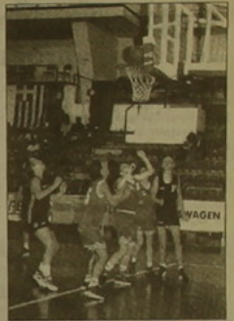
Վերջին խաղերը կորոնեն հանրաժանական առաջնության հարթոլին ու մրցանակակիրներին:

Գյումրիում անցկացվեց Հայաստանի կանանց առաջնության առաջին օրը՝ Բուլղարիայի փուլի մրցաօրը: Առաջատարն երեւանի «Գրանդ-1» քիմիկ ընդհուպ մտեցավ Արարատի «Ավարայրը», որը կարողացավ վերջին տուրում դարձնել մասնակցի մինչ այդ միայն հարթանակներ տնտեսող մրցակցին: